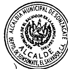
Héctor Antonio Orellana Valladares Alcalde Municipal de Sonzacate