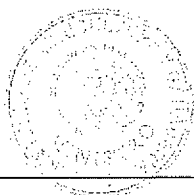
Pablo Salvador Anliker Infante Ministro de Agricultura y Ganadería