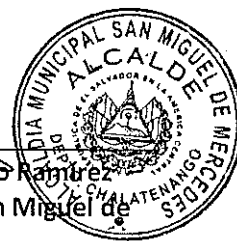
Milton Guadalupe Serrano Ramírez Alcalde Municipal de San Miguel de Mercedes