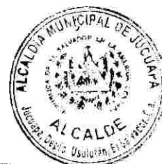
José Manuel Turcios Ruíz Alcalde Municipal de Jucuapa