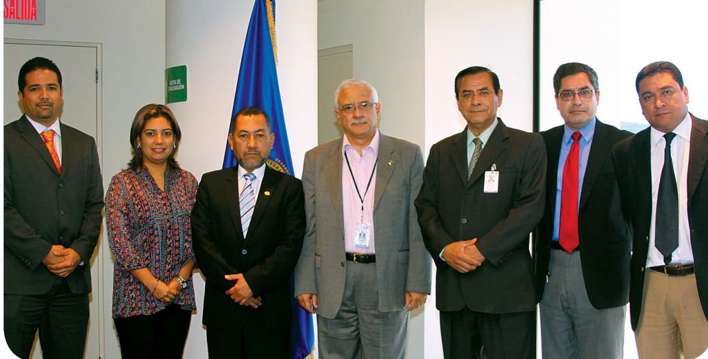
Depósito de Resolución Número Cinco del Reglamento Regional OSP-05-11 para Prohibir la Práctica del Aleteo del Tiburón en los Países parte del SICA al Secretario General del SICA