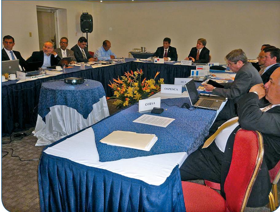
Aprobación de la Resolución No. 005 por los Señores Ministros Responsables de las Actividades Pesqueras y Acuícolas de los países integrantes del SICA.