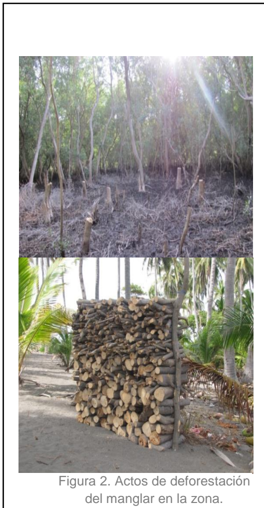
Figura 2. Actos de deforestación del manglar en la zona.

El manglar de Garita Palmera posee un ecosistema que ha sido reducido a 200 hectáreas, de las cuales la mitad han sido taladas casi totalmente, mientras que en la otra mitad, el promedio de tala encontrado, es de 1200 árboles por hectárea (UICN, 2012).