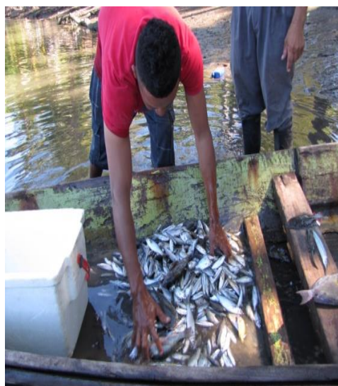
Figura 3. Pesca de especies de valor comercial bajo talla.

Se observó que pescan “chimberas” de 5 a 22 cm de largo y “jurel” de 4.5 a 7.3 cm de largo, lo cual genera una sobre explotación del recurso, extrayendo peces juveniles que aún no han generado descendencia, este aspecto es crítico ya que una pareja de pescadores pueden pescar entre 15 a 18 lbs., al día y si diariamente se