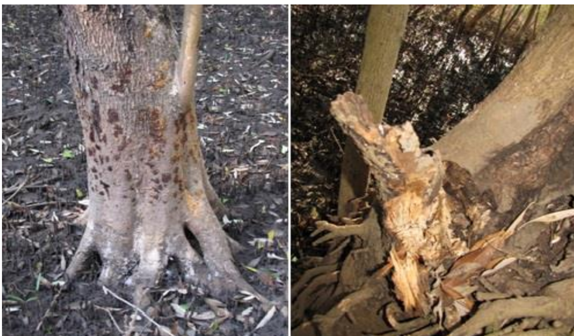
Figura 1. Enfermedades y plagas en Istatén ( Avicennia germinans ).

Una vez seco el árbol la comunidad los ha extraído para su utilización y aprovechamiento para leña, vigas o postes.