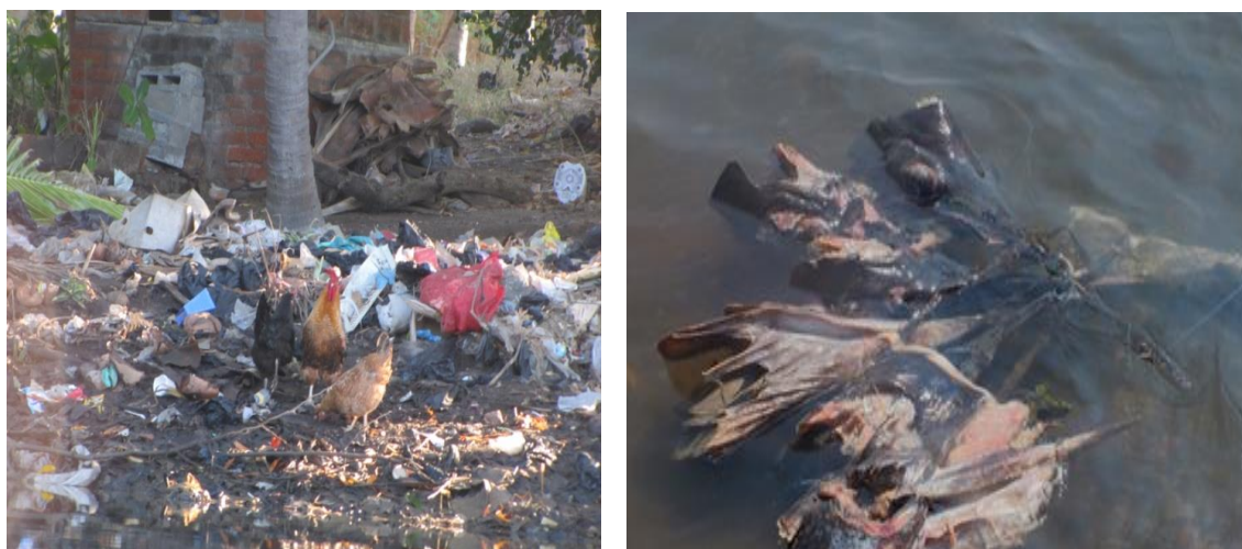
Figura 4. Basura (plástico), desperdicios de la pesca, disposición de aguas servidas.

Las aguas provenientes del uso doméstico y de los negocios locales, así como de granjas familiares de gallinas y cerdos que se convierten en fuente de contaminación, ya que se dispone sin tratamiento alguno sobre la superficie del suelo arenoso y fuertemente permeable lo cual hace que este tipo de aguas servidas se percolen hacia los mantos acuíferos superficiales contaminándolos de esta manera.