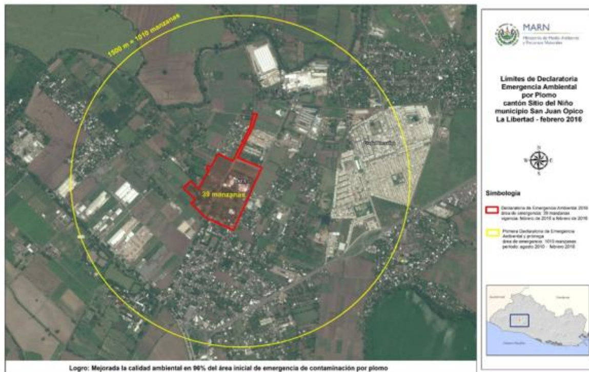
Figura 1. Límites de Declaratoria de Emergencia Ambiental por Plomo en Sitio del Niño

La delimitación del área en la que se están realizando acciones prioritarias para remediar la contaminación por plomo se presentan en la figura 1.