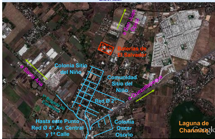
Esquema de Ubicación de Redes de Distribución de ANDA, en Sitio del Niño, Inmediaciones de Baterías de El Salvador, San Juan Opico, departamento de La Libertad.