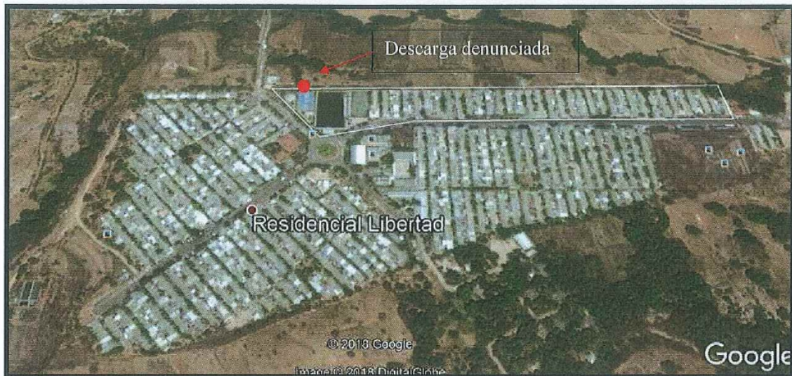
Ilustración 3. El sector rodeado con un contorno blanco, se observaron descargas de agua residual en las canaletas de agua lluvia.

No se conoce el destino final de las aguas lluvias, sin embargo, se confirma mediante inspección visual que existen varias conexiones ilegales de aguas residuales a estas canaletas. El sector inspeccionado es el que se muestra a continuación: