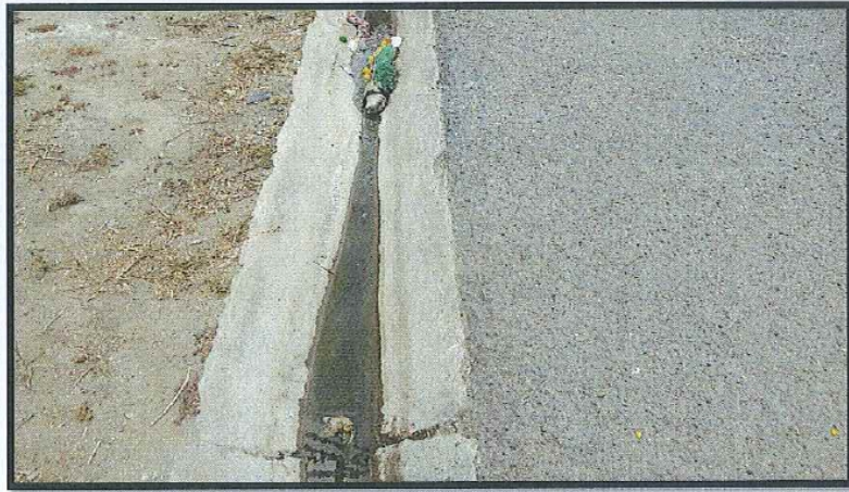
Ilustración 2. Canaletas de aguas pluviales con descarga de aguas residuales.