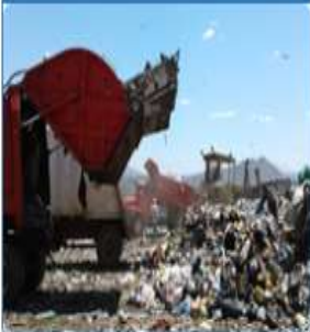
Manejo inadecuado de desechos sólidos