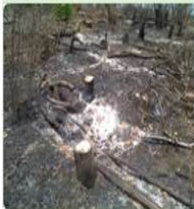
Degradación de Área Natural Protegida