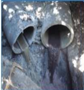
Descarga o vertido a medio receptor