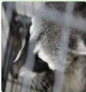
Depredación y/o extracción de ecosistemas y especies