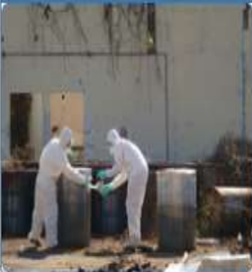
Manejo inadecuado de sustancias, residuos y desechos peligrosos