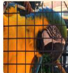
Especie de vida silvestre