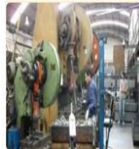
Generación de ruidos por actividades industriales