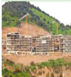
Construcción y actividades en zonas frágiles