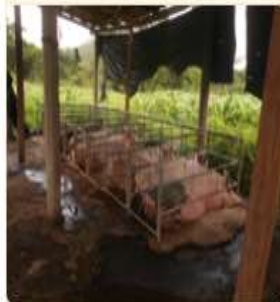
Contaminación por actividades productivas