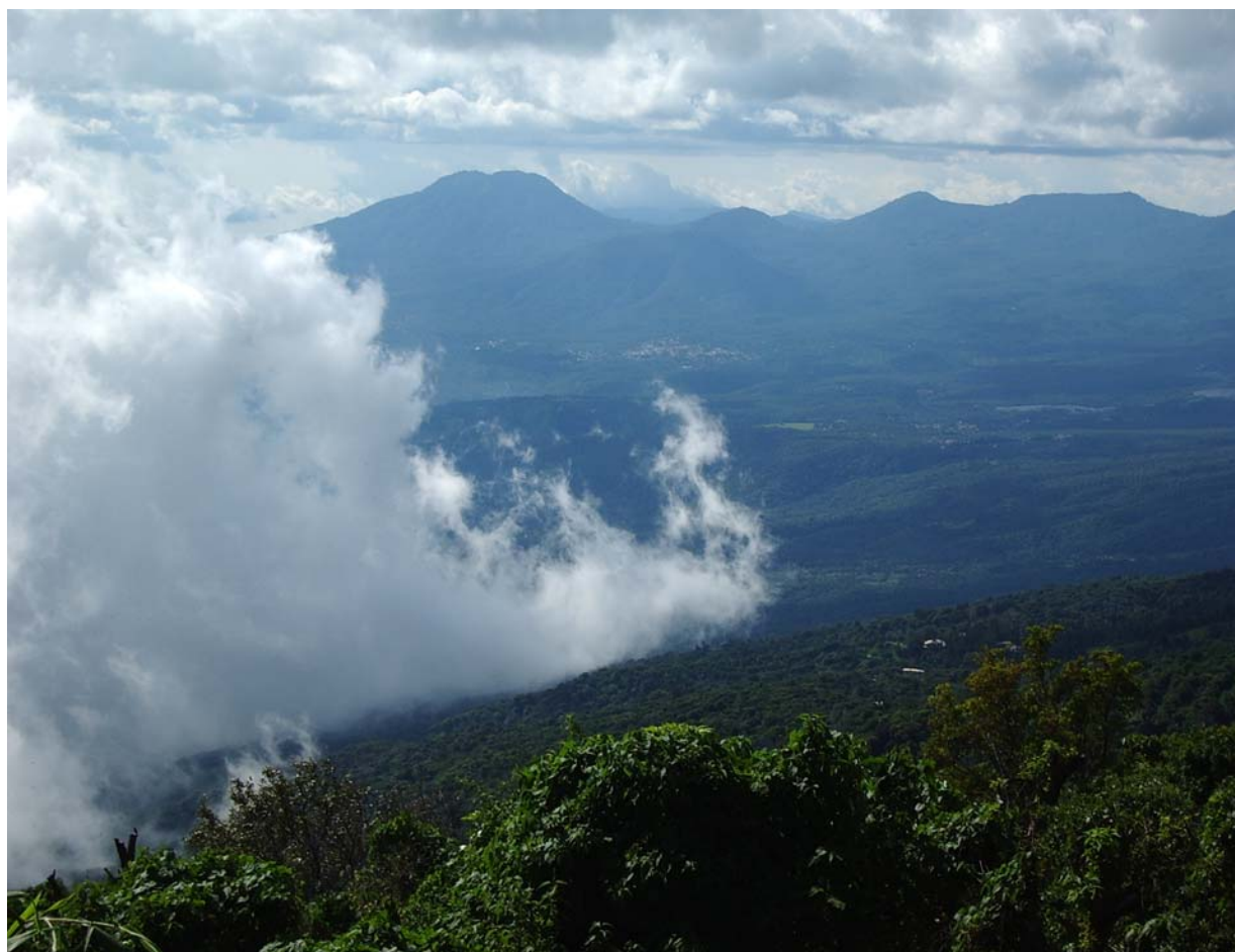
Cordillera de Apaneca

Sin embargo todos estos esfuerzos están dispersos en el área. La declaración de la Reserva de la Biosfera aportará, sin duda, en la integración y articulación de todos estos esfuerzos y de las instituciones que los impulsan a través del plan general de gestión de la Reserva de la Biosfera Apaneca - Ilamatepec.