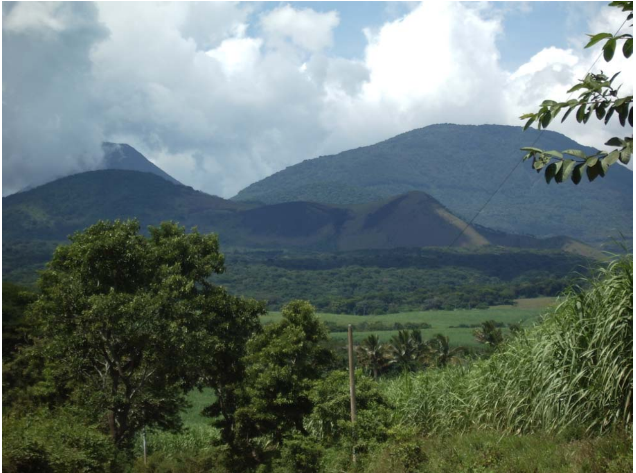
Zona de Transición Reserva de la Biosfera Apaneca - Iamatepec

A la fecha no se ha establecido aún un Comité Nacional MAB en El Salvador.