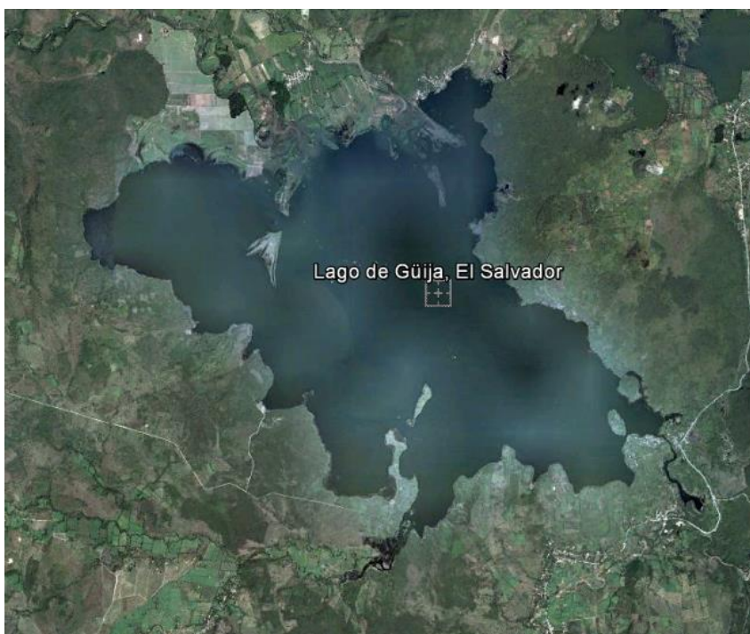
Mapa No. 1 Lago de Güija

La zona es de gran importancia desde el punto de vista ambiental, debido a que el Lago de Güija está clasificado como sitio Ramsar 1 , dicho humedal da soporte a actividades productivas y de recreación en la zona y aporta recursos hídricos superficiales al Río Lempa el cual abastece la Planta Potabilizadora de las Pavas que abastece de agua potable del Área Metropolitana de San Salvador (AMSS).