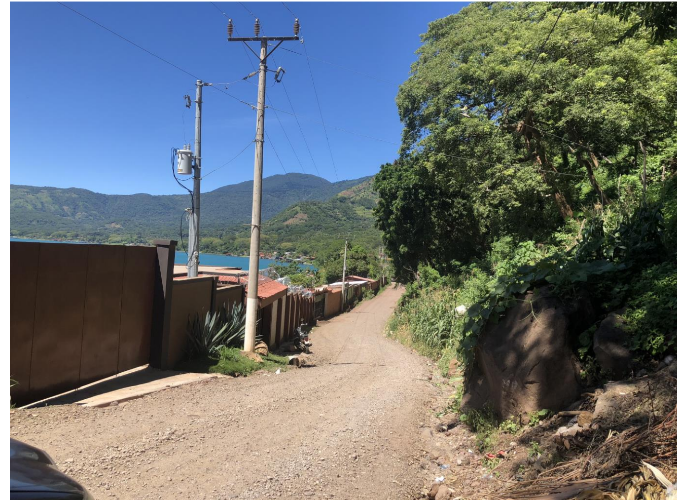
Edificaciones colindantes con espejo de agua.