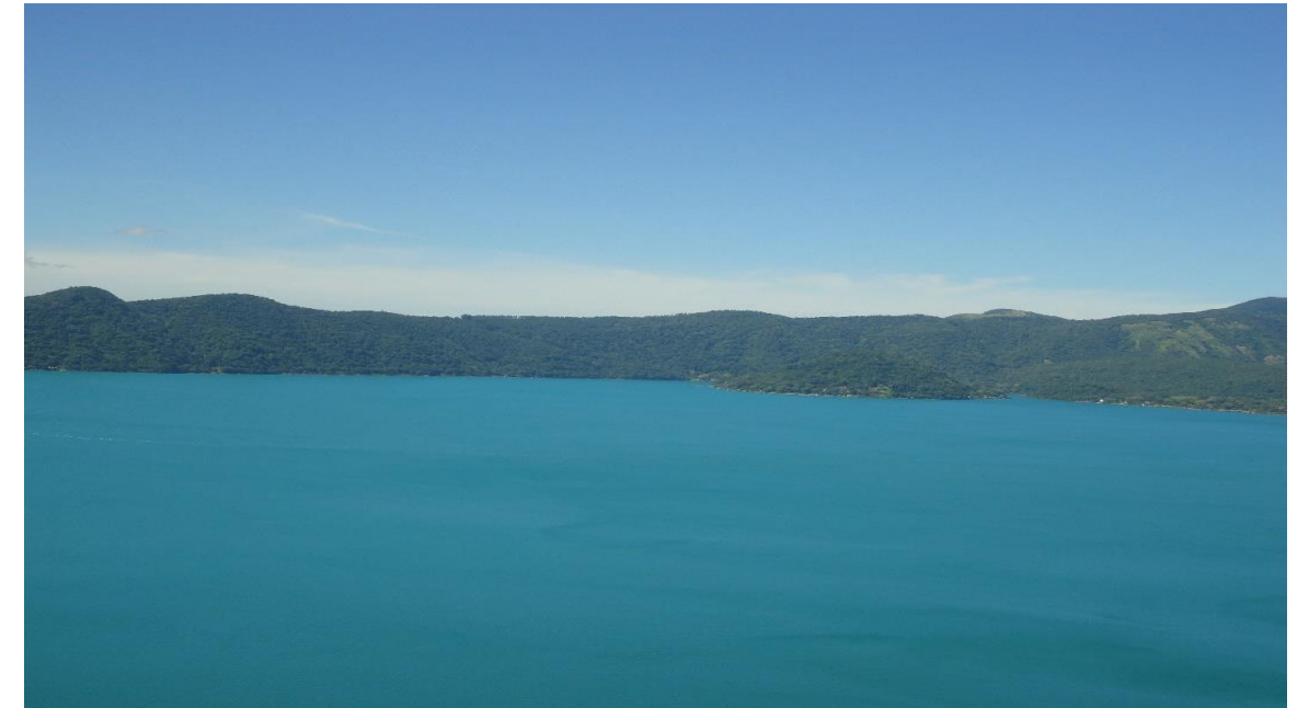
Espejo de agua del Lago de Coatepeque.