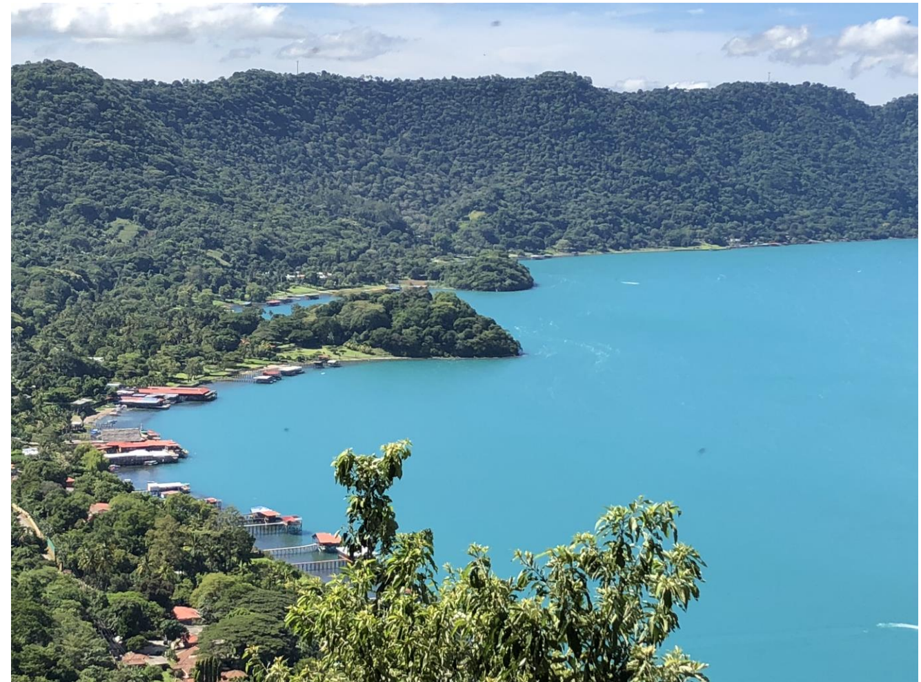
Panorámica del Lago de Coatepeque.

A continuación, se presenta el cuadro detalle de áreas de la zonificación ambiental y usos del suelo para la cuenca del Lago de Coatepeque, mapa de usos de suelo, mapa de la zonificación ambiental y sus lineamientos de actuación: