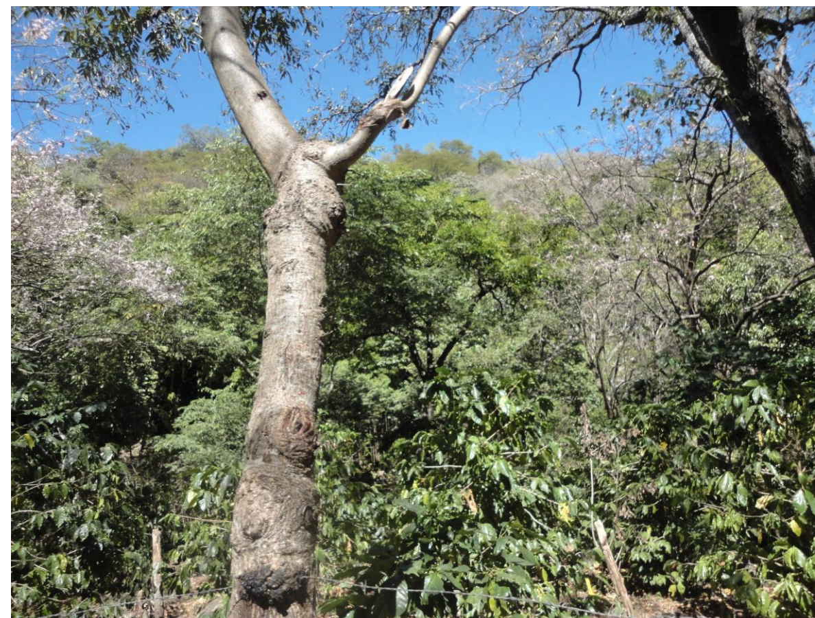
Bosque de cafetal.