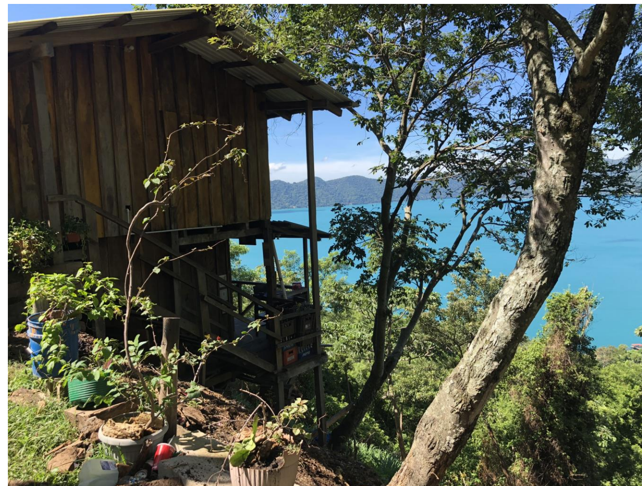
Edificaciones en zona de susceptibilidad a deslizamientos.