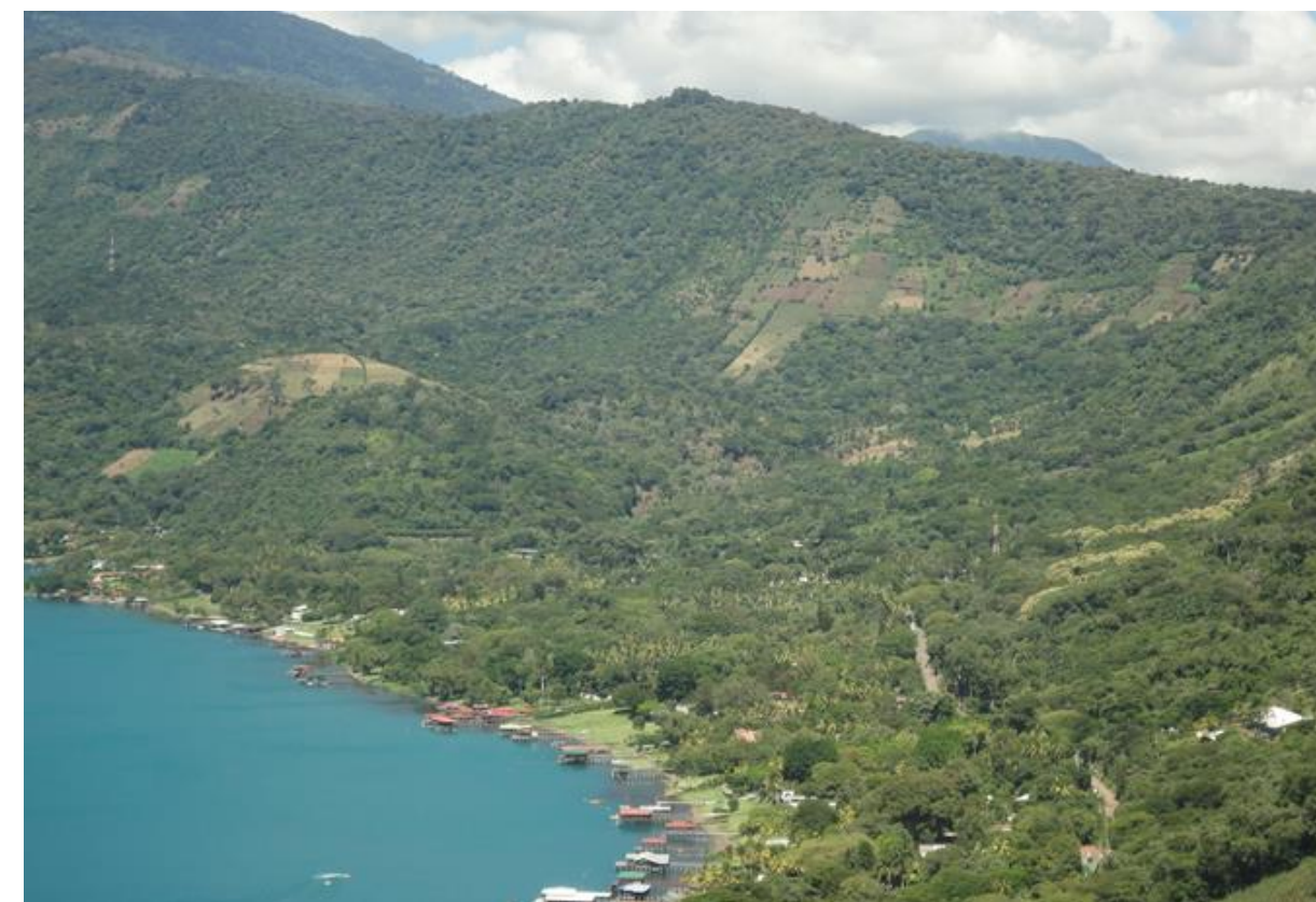
Cultivos anuales en ladera de lago de Coatepeque.