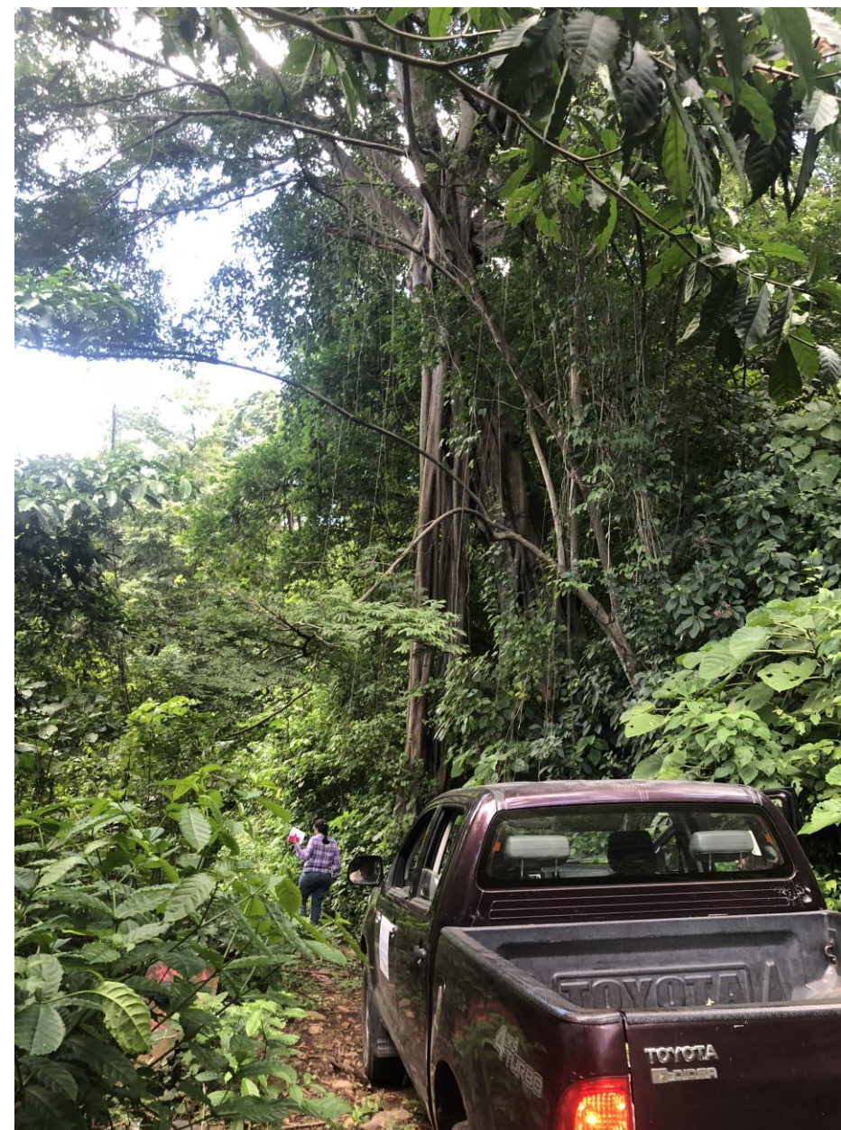
Bosques siempre verdes.