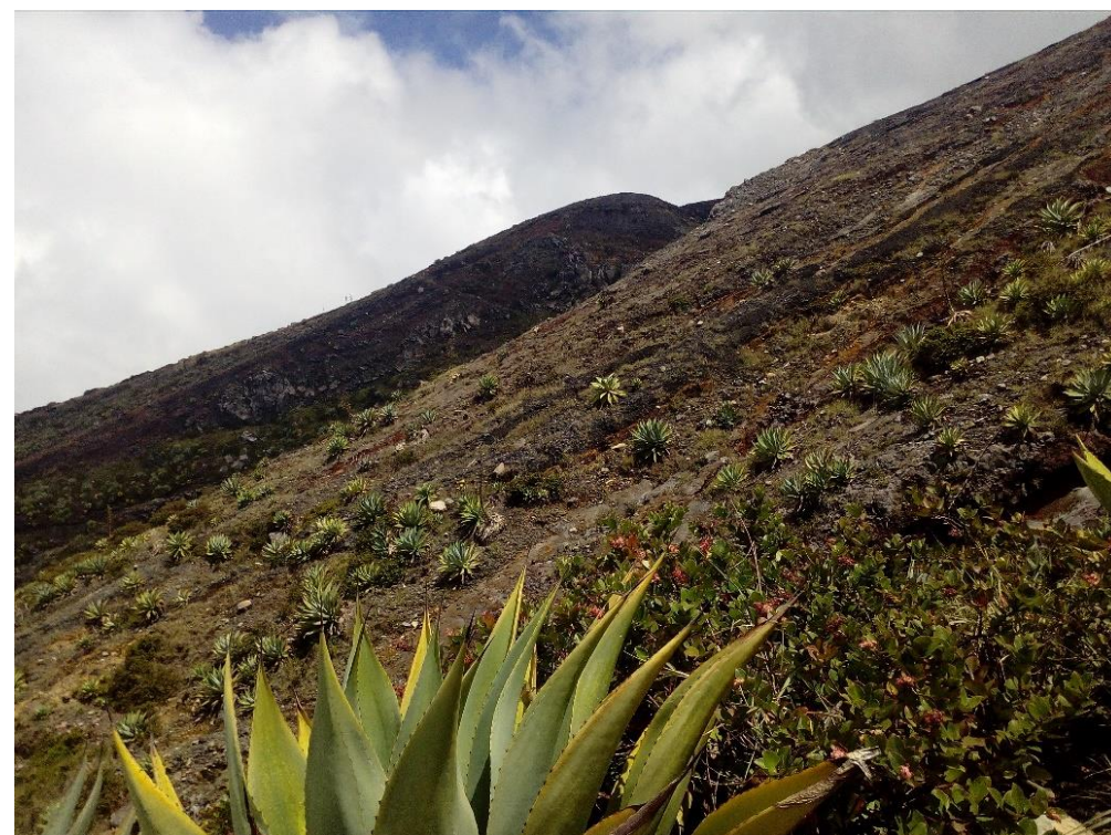
Vegetación de páramo en área natural protegida volcán de Santa Ana.