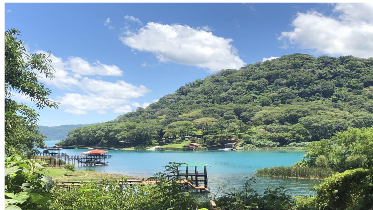
Edificaciones de segunda residencia en bosque.