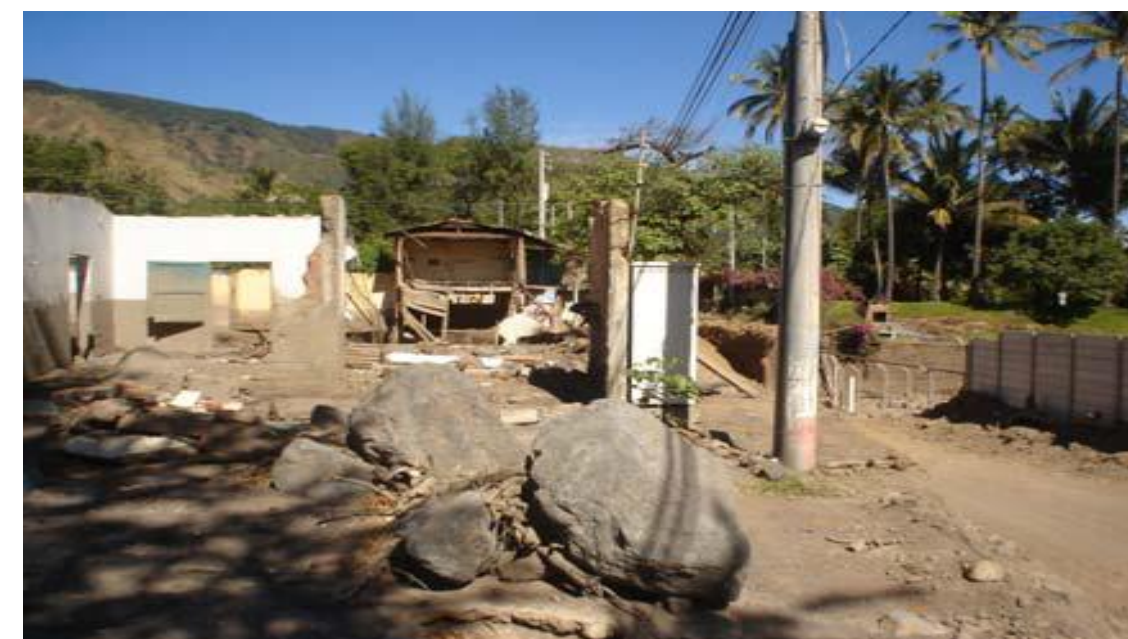
Lahar en quebrada el Javillal, Cuenca del Lago de Coatepeque.