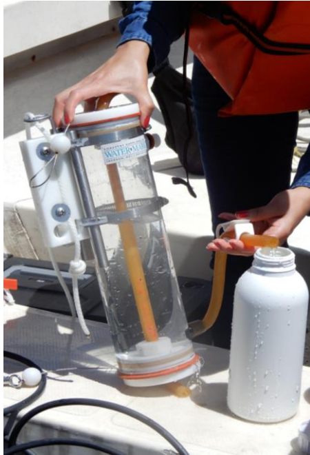
Llenado de frascos con agua para traslado de muestras al Laboratorio de Calidad de Agua MARN