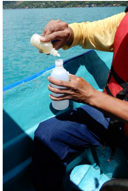
Preservación de muestras de aguas para diversos análisis y posterior traslado al Laboratorio de Calidad de Agua