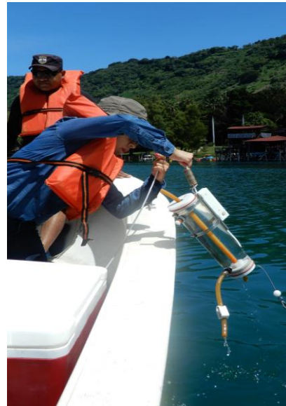
Recolección de muestras de agua con la botella de profundidad de kemmerer a una profundidad de 2 metros