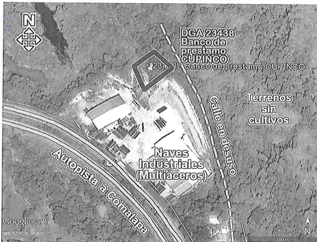
Figura 2 – El terreno y sus colindantes.