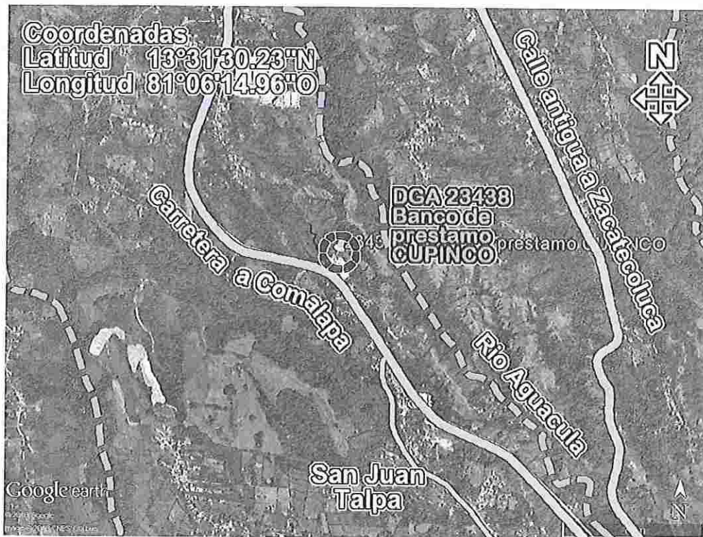
Figura 1 – Croquis de ubicación del terreno