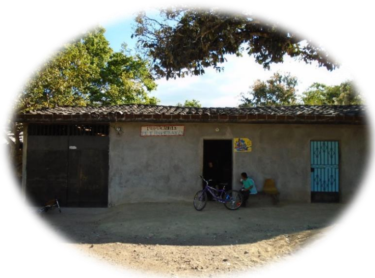
ILUSTRACION N° 3: IMAGEN DE VIVIENDAS DE CONSTRUCCION MIXTA EN MEANGUERA

Meanguera tiene un IDH de 0.642 que lo ubica en el puesto 212 dentro de los 262 municipios del país, con un índice similar al de los municipios de Perquín, Jocoaitique, Osicala, Sociedad y El Divisadero. De acuerdo a la clasificación de pobreza a nivel nacional, se ubica como un municipio de pobreza extrema moderada y según revela el Mapa de pobreza urbana y exclusión social, presentado por Facultad Latinoamericana de Estudios Sociales (FLACSO) El Salvador y