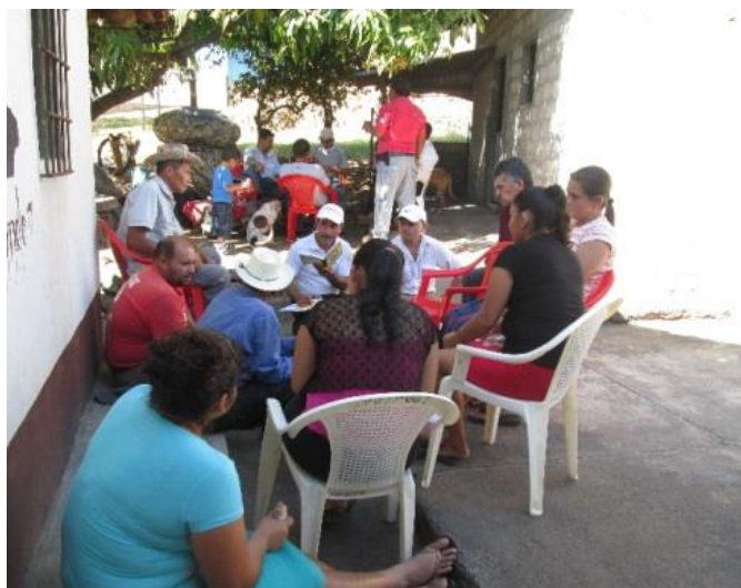
ILUSTRACIÓN N° 9: REUNION DE PLANIFICACION CON JOVENES, ADULTOS MAYORES Y MUJERES

Meanguera realiza esfuerzos encaminados a proveer necesidades básicas que demandan grupos poblacionales vulnerables o en riesgo, es así como se apoya una escuela para niños y niñas especiales, la que está diseñada para atender infantes de todo el municipio pero que por falta de fondos no se alcanzan a cubrir en su totalidad; de igual forma se apoya al sector de adultos mayores brindándoles ayuda alimentaria y servicios médicos, hasta donde lo permiten los escasos fondos de