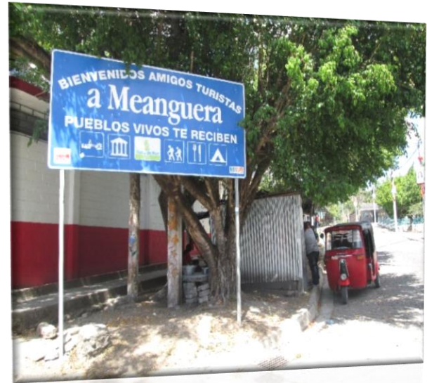
ILUSTRACIÓN N° 6: AMBIENTE URBANO

1. El municipio presenta un bajo índice delincencial que corre el riesgo de incrementarse si no se toman acciones preventivas. Es de tomar en cuenta que los sitios que comienzan a evidenciar incremento de los niveles de delincuencia son los más alejados al área urbana. En consideración a esta situación es necesario diseñar e implementar acciones de prevención de la violencia de manera coordinada entre la PNC, la municipalidad y las comunidades organizadas.