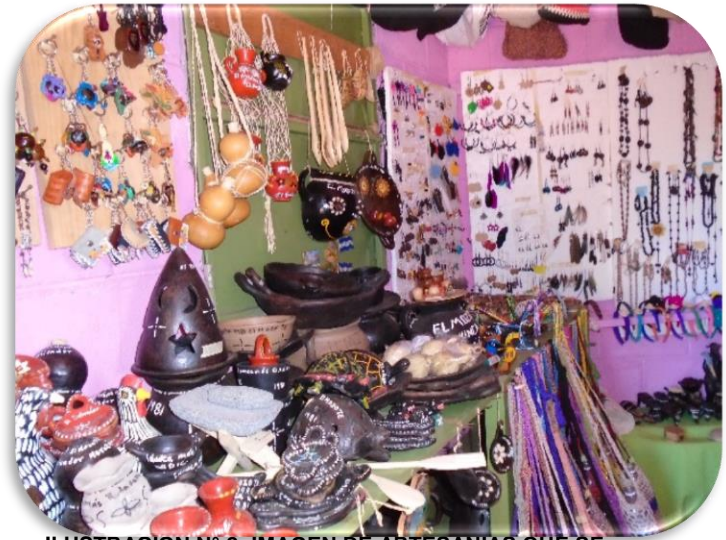
ILUSTRACION N° 2: IMAGEN DE ARTESANIAS QUE SE ELABORAN EN EL MOZOTE, MEANGUERA

Meanguera es nombre de origen lenca y en el idioma Potón, hablado por aborígenes, significa "la ciudad de las jadeítas". Su base de población procede de la Isla de Meanguera del Golfo de Fonseca, de la cual emigraron aterrorizados por las continuas depredaciones de los piratas ingleses, que infestaban las costas americanas en ambos Océanos.