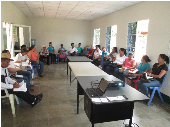
ILUSTRACIÓN N° 14: TALLER DE SOCIALIZACION DEL PEP CON INSTITUCIONES LOCALES

Los problemas y necesidades que se identificaron en el ámbito político institucional se concentran en el área de la gestión municipal, principalmente en la necesidad de propiciar mejores servicios a la población y liderar un proceso de desarrollo socioeconómico sostenido con la participación de todos los actores y sectores del municipio. De esta forma, es notoria la necesidad de modernizar los sistemas administrativos y de prestación de servicios de la municipalidad, así como de capacitar al recurso humano e implementar un sistema de planificación, seguimiento y monitoreo que le facilite un proceso de mejora continua.