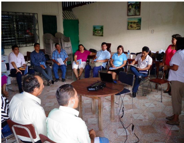
ILUSTRACION No. 16: SOCIALIZACION DE LA ESTRATEGIA DE COMUNICACIÓN Y GESTIÓN CON EL GRUPO GESTOR

El proceso de planificación estratégica realizado en el municipio, será acompañado en su ejecución con una estrategia de comunicación y gestión del PEP. La comunicación es el medio por el cual la ciudadanía y actores se informan, se involucran y participan sobre las decisiones que los gobiernos adoptan. Para poder comprometerse en los temas de interés colectivo, se necesita conocer e informarse, de manera que se legitime una gestión del desarrollo equitativa e inclusiva.