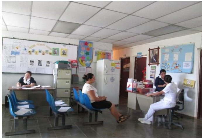
ILUSTRACIÓN N° 7: SERVICIO DE SALUD EN EL MUNICIPIO DE MEANGUERA

Existen servicios básicos que resultan en extremo necesarios para la supervivencia de la población, tal es el caso de la necesidad de agua de buena calidad y cantidad suficiente, así como adecuados y oportunos servicios de salud y educación. Estos, regularmente no están cubiertos al cien por ciento en el municipio por lo que se vuelve importante realizar las gestiones necesarias para su prestación.