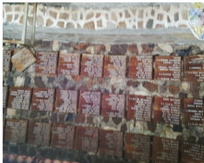
ILUSTRACIÓN N° 13: PLACAS CON NOMBRES DE LAS FAMILIAS QUE MURIERON EN LA GUERRA. CASERIO EL MOZOTE