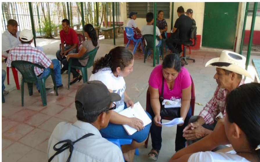
ILUSTRACION No.1: REUNIONES DE TRABAJO CON EL GRUPO GESTOR

Adicionalmente se definieron los mecanismos de elección e integración de la Instancia de Participación Permanente IPP, la que fue presentada al Concejo para la elaboración del Acuerdo Municipal, donde se ratifica el compromiso para la implementación, seguimiento, divulgación y evaluación del PEP con énfasis en desarrollo económico, la aprobación de la IPP y el compromiso de aportar financieramente para su funcionamiento.