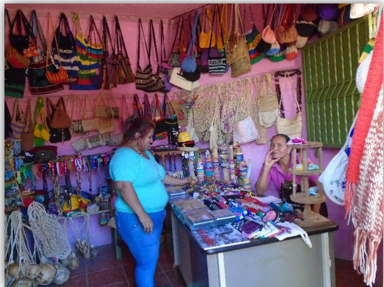
ILUSTRACIÓN N° 12: MICROEMPRESA DE ARTESANIAS EN CASERIO EL MOZOTE

La dinámica empresarial en el municipio es incipiente a pesar de que se han llevado a cabo servicios de apoyo en capacitación, financiamiento y formación para el empleo y autoempleo. Regularmente estas iniciativas no han generado los resultados esperados, principalmente porque continúan siendo escasas en relación a la demanda y porque carecen de coordinación entre los actores que participan en la cadena laboral o de negocios.