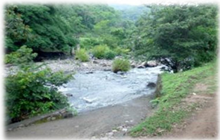
ILUSTRACIÓN N° 5: IMAGEN DE LA BIODIVERSIDAD LOCAL

Con una temperatura promedio de 20 °C, una precipitación media anual de 2,400 a 2,900 mm y una época seca muy marcada de octubre a marzo, Meanguera es uno de los municipios más cálidos de la zona norte de Morazán, pudiendo alcanzar temperaturas de hasta 33 °C. Presenta un relieve