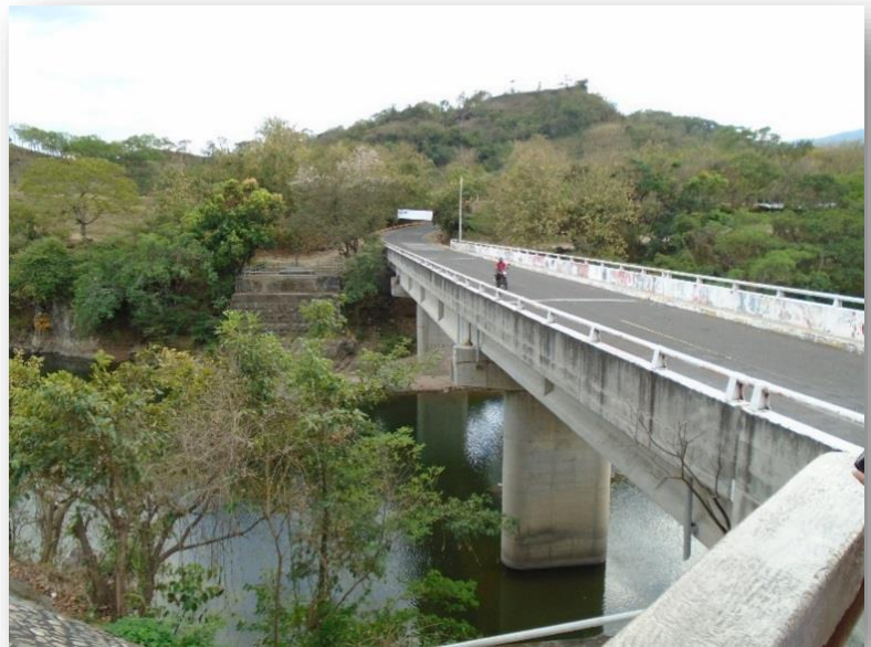
ILUSTRACIÓN N° 10: PUENTE SOBRE EL RIO TOROLA, MEANGUERA, MORAZAN.

Un tema clave para el desarrollo del municipio lo constituye su infraestructura comunitaria, siendo la red vial, la red eléctrica y las condiciones de vivienda aspectos esenciales para que la población pueda desenvolverse en un entorno favorable que le facilite planear su desarrollo. En tal sentido las comunidades presentan muchas demandas en torno al mejoramiento, apertura y garantía de seguridad en el uso de las calles internas y externas, así mismo plantean la necesidad de una eficiente infraestructura eléctrica y de un sistema digno de vivienda que les garantice mayor seguridad en el entorno que les rodea.