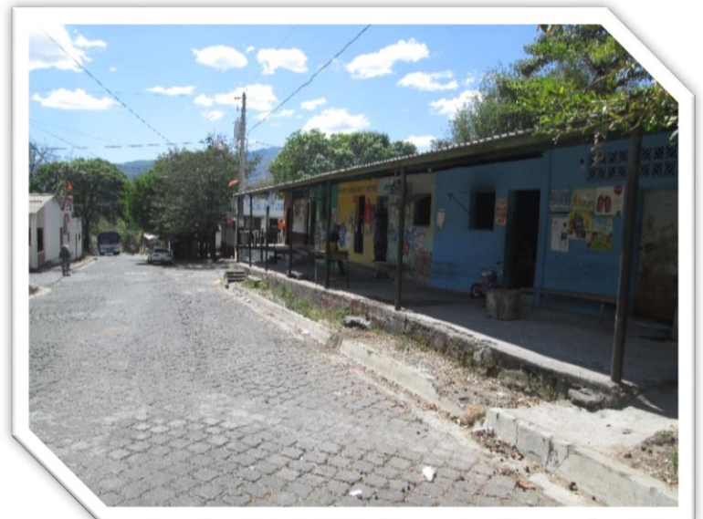
ILUSTRACION N °4: IMAGEN DE COMERCIOS EN EL AREA URBANA DE MEANGUERA

De acuerdo al Informe 262 del PNUD 2009, el porcentaje de hogares con miembros que se han ido a vivir permanentemente a otro país es del 15 %, mientras que el porcentaje de familias que reciben remesas es de 9.7 %