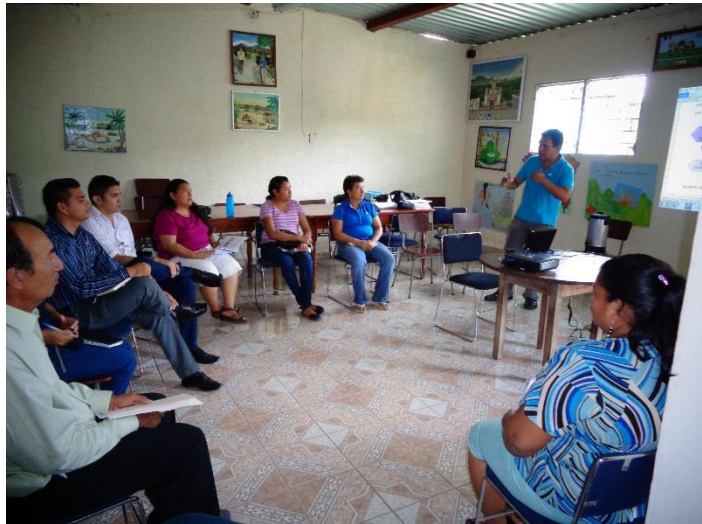
ILUSTRACION No. 15: SOCIALIZACION DE LA ESTRATEGIA DE SEGUIMIENTO Y EVALUACION CON EL GRUPO GESTOR

La implementación de la presente estrategia de seguimiento y evaluación tienen como propósito hacer visibles las Instancias de Participación Permanente y las organizaciones sociales que las conforman, de manera que éstas logren insertarse en los espacios de deliberación pública municipal y desarrollar en ellos una actividad crítica y propositiva, enmarcada en un concepto de ciudadanía activa y de búsqueda de un mejor vivir.