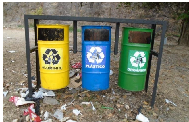
ILUSTRACIÓN N° 13: CONTENEDORES PARA RECOLECCION Y SEPARACION DE DESECHOS SOLIDOS

Es muy importante la atención a la problemática ambiental y de riesgos existente en el municipio. Dentro de las principales demandas de la población, el tema del manejo de los desechos sólidos, la protección ambiental del agua, suelo y bosque, así como la reducción del riesgo en puntos críticos; resultaron ser los más mencionados; con variantes que se