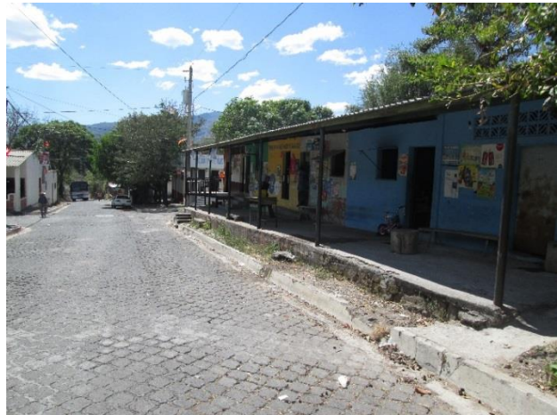
ILUSTRACIÓN N° 8: AMBIENTE URBANO DE MEANGUERA

Una de las necesidades mayormente manifestada en las consultas territoriales es la carencia de espacios apropiados para actividades de convivio comunitario, incluyendo la necesidad de espacios para reuniones y acciones colectivas durante la gestión del desarrollo de sus comunidades. De igual forma la población demanda espacios de recreación, cultura y deporte, haciendo ver lo importante de esto último para promover una convivencia sana y pacífica de la población, donde la juventud tenga opciones para no sucumbir ante el riesgo delincuencia o de agrupaciones ilícitas.