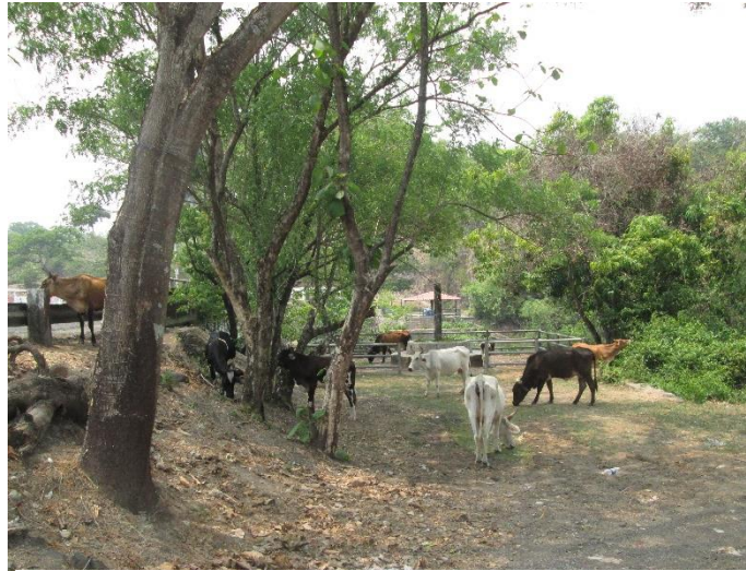
ILUSTRACIÓN N° 11: ACTIVIDAD GANADERA EN EL MUNICIPIO DE MEANGUERA

El sector agropecuario es clave para robustecer la economía del municipio y crear oportunidades de empleo y negocio para la población, considerando que este es el sector productivo mayoritario sobre el cual se fundamenta la generación de ingresos y seguridad alimentaria de las familias. En tal sentido los productores agropecuarios plantean situaciones problemáticas en torno a sus sistemas de producción, la mayoría de las cuales se relacionan con dos grandes temas: