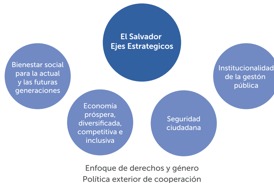
Plan Estratégico por Resultados 2019 - 2024

El gobierno central plantea cuatro ejes estratégicos, como se muestra en la siguiente figura: