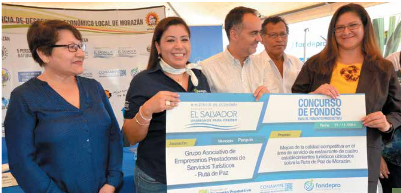
Entrega de fondos no reembolsables para Fomento productivo

En éste ámbito de acción, se logró la formalización de 520 MYPE's a través de asistencia técnica y trámites especializados. Este servicio se ha desarrollado a través de los Centros de Desarrollo Económico Local de CONAMYPE (CRDEL) y a través de las ventanillas de empresariedad femenina en las sedes de Ciudad Mujer.