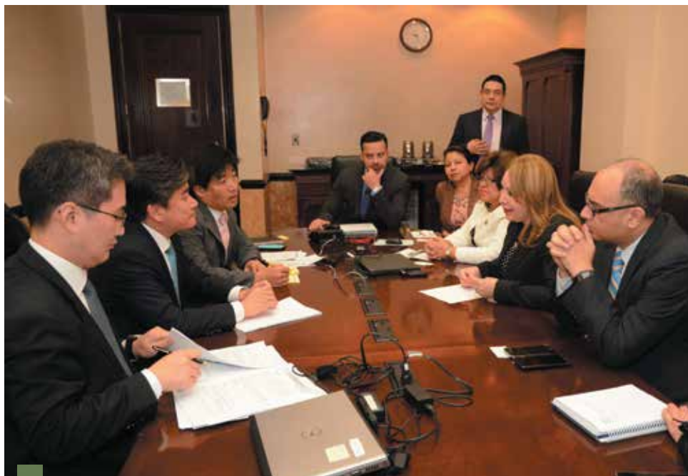
Inicio de las negociaciones para TLC con Corea

Se realizó el lanzamiento de la “Guía para la utilización y el aprovechamiento del acuerdo de asociación entre Centroamérica y la Unión Europea”, orientada principalmente para ser utilizada por las micro y pequeñas empresas del país.