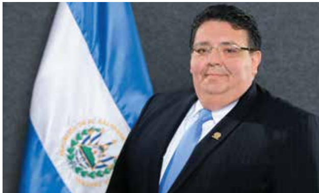
Ministro de Economía Lic. Tharsis Salomón López

La rendición de cuentas constituye un mecanismo propio de un Estado democrático que ofrece la oportunidad para que los funcionarios públicos expliquen sus actuaciones y decisiones a la población. Es a su vez, un concepto íntimamente ligado con otros como el de participación ciudadana, transparencia, acceso a información pública que, en su conjunto, contribuyen a fomentar un cultura de integridad en las instituciones.