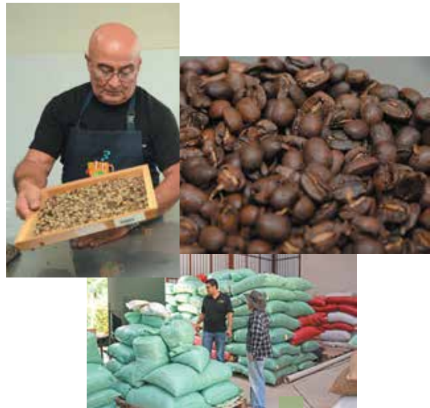
Nuevas oportunidades para productores de café

A nivel regional, y en cumplimiento al mandato emanado de la Declaración de Presidentes de junio de 2014, el MINEC junto con los otros Ministerios de Economía de la región, está trabajando en la adopción e implementación de una estrategia centroamericana de facilitación de comercio y competitividad, dando énfasis a la gestión coordinada de fronteras en el corredor logístico centroamericano y articulada alrededor de ocho ejes de trabajo: a) la estandarización del Modelo de Gestión Coordinada de Fronteras; b) el establecimiento de ventanillas únicas electrónicas; c) la gestión integral de riesgos; d) operadores económicos confiables; e) control cuarentenario; f) integración de procedimientos y control; g) infraestructura y equipamiento; y h) comunidad fronteriza. El plan fue presentado el 9 de noviembre y actualmente está en un proceso de consulta nacional y validación por parte de los países centroamericanos.