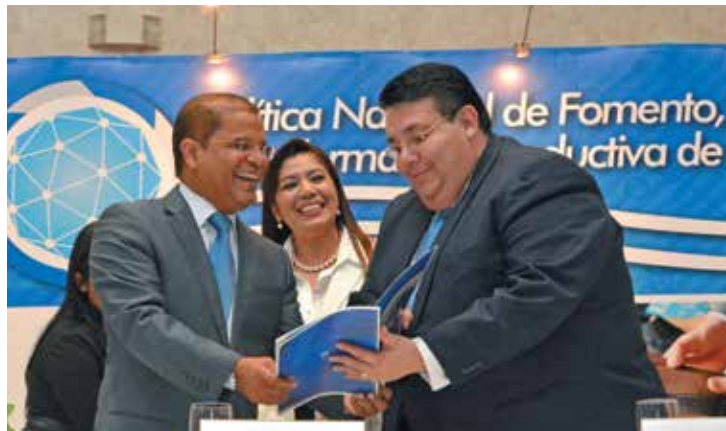
Entrega de Política Nacional de Fomento, Diversificación y Transformación Productiva.

Como parte del proceso de implementación de esta política se han implementado acciones en las áreas de Capacitación y formación empresarial, con las cuales se fortalecieron las capacidades institucionales y del sector privado por medio de la realización de talleres especializados de capacitación y formación, beneficiando alrededor de 490 personas, y en las que se abordaron temas tan relevantes como internacionalización de servicios de valor agregado, cumplimiento de normas y estándares de calidad, diseño y comercialización de productos digitales (videojuegos, animación digital y audiovisuales), entre otros.