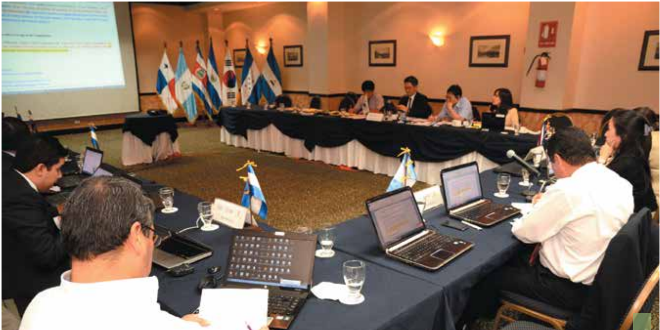
Las negociaciones comerciales con diversos países han sido intensas

La agenda de negociaciones comerciales también ha sido intensa. En octubre de 2014 finalizó la última ronda de negociación del Acuerdo de Alcance Parcial con Trinidad y Tobago, con el cual se pretende contribuir a incrementar en un 10% las exportaciones salvadoreñas hacia el Caribe, se iniciaron las negociaciones para ampliar el Acuerdo Alcance Parcial entre El Salvador y Venezuela vigente desde el año 1986; se retomó la negociación del Acuerdo de Libre Comercio con Canadá, y se han iniciado el proceso de negociación de un Tratado de Libre Comercio con Corea del Sur