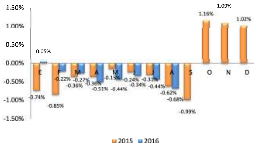
GRÁFICO 2 EL SALVADOR: VARIACIÓN PORCENTUAL ACUMULADA DEL IPC GENERAL, POR AÑO 2015 – 2016