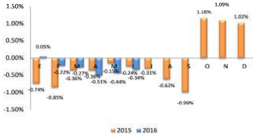
GRÁFICO 2 EL SALVADOR: VARIACIÓN PORCENTUAL ACUMULADA DEL IPC GENERAL, POR AÑO 2015 – 2016