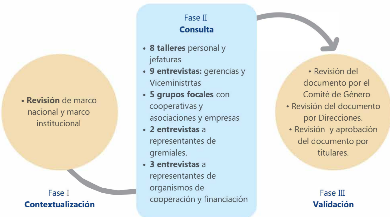
Esquema 2. Proceso de formulación de la Política