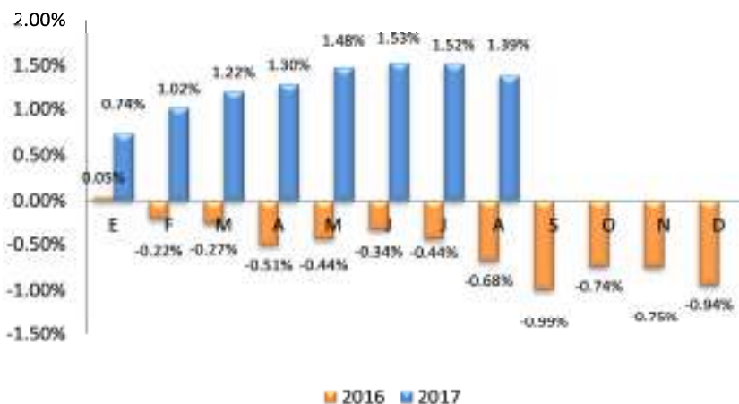
GRÁFICO 2 EL SALVADOR: VARIACIÓN PORCENTUAL ACUMULADA DEL IPC GENERAL, POR AÑO 2016 – 2017