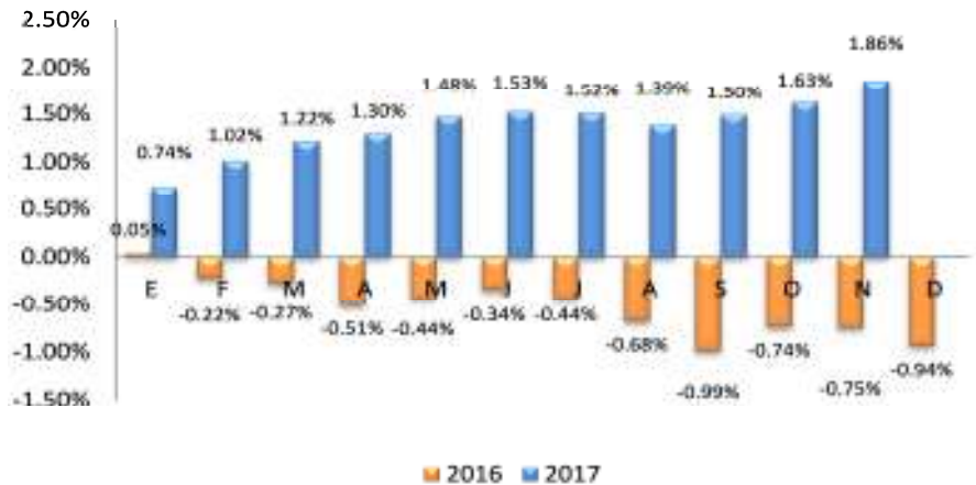
GRÁFICO 2 EL SALVADOR: VARIACIÓN PORCENTUAL ACUMULADA DEL IPC GENERAL, POR AÑO 2016 – 2017