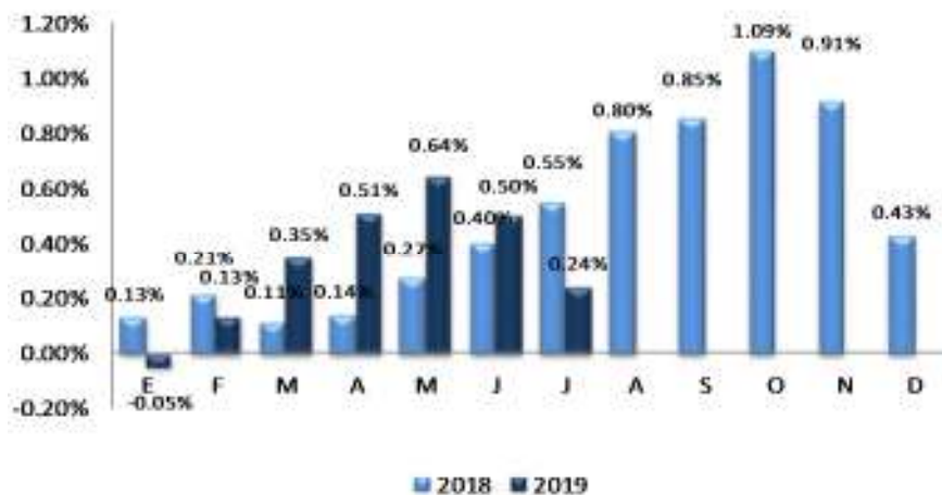
GRÁFICO 2 EL SALVADOR: VARIACIÓN PORCENTUAL ACUMULADA DEL IPC GENERAL, POR AÑO 2018 – 2019

En el gráfico 2, se muestra el comportamiento acumulado mensual del IPC para el año 2018 y 2019, en el cual se observa una disminución de 0.31 puntos porcentuales en 2019, al pasar el índice de 0.55% en julio 2018 a 0.24% en julio 2019, motivado por un menor ritmo de variación en los precios en general, lo cual contribuye a mantener un nivel de inflación relativamente inferior al registrado en julio 2018.