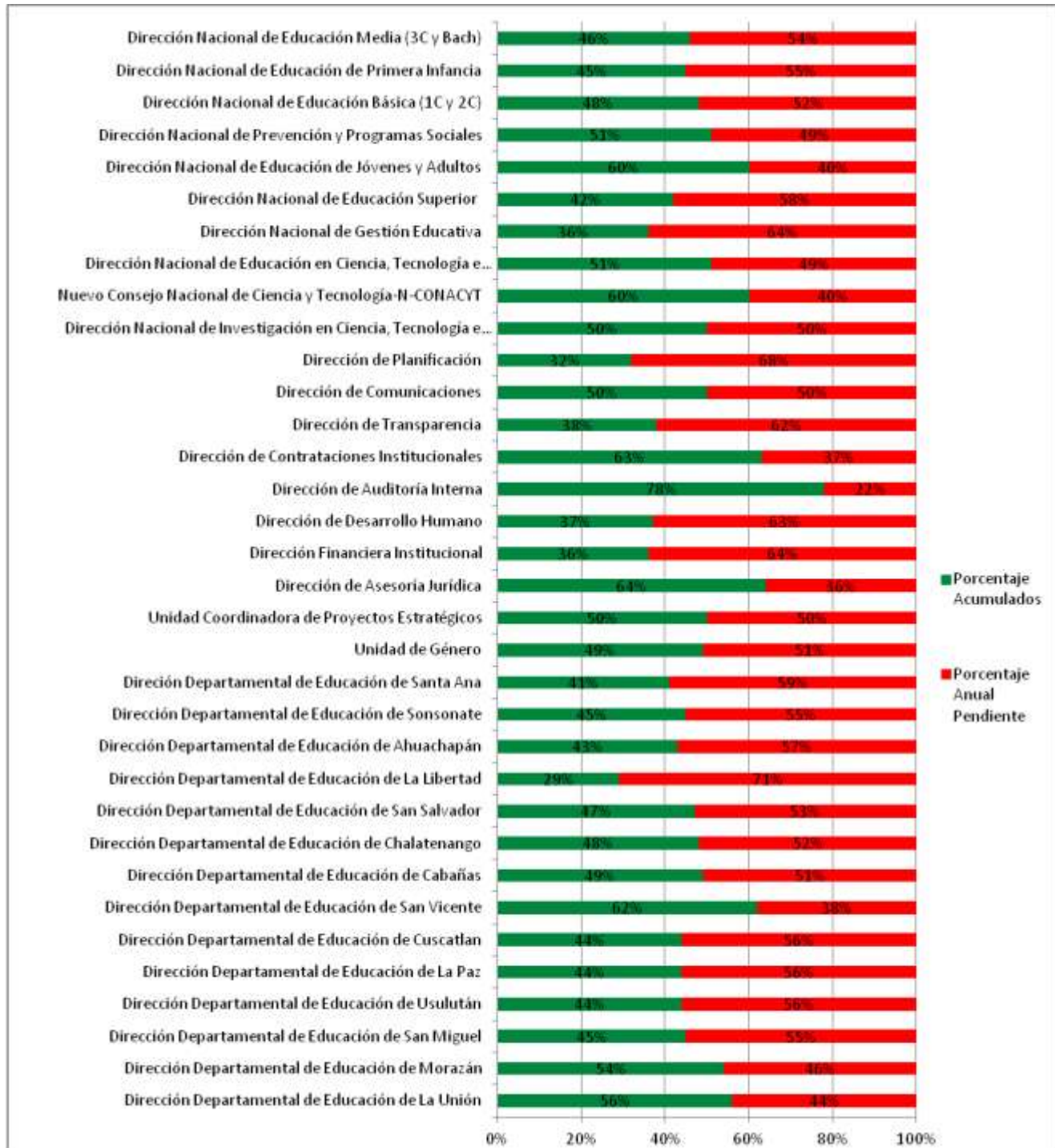
Gráfico de nivel de avances de Macroactividades Segundo Trimestre 2017