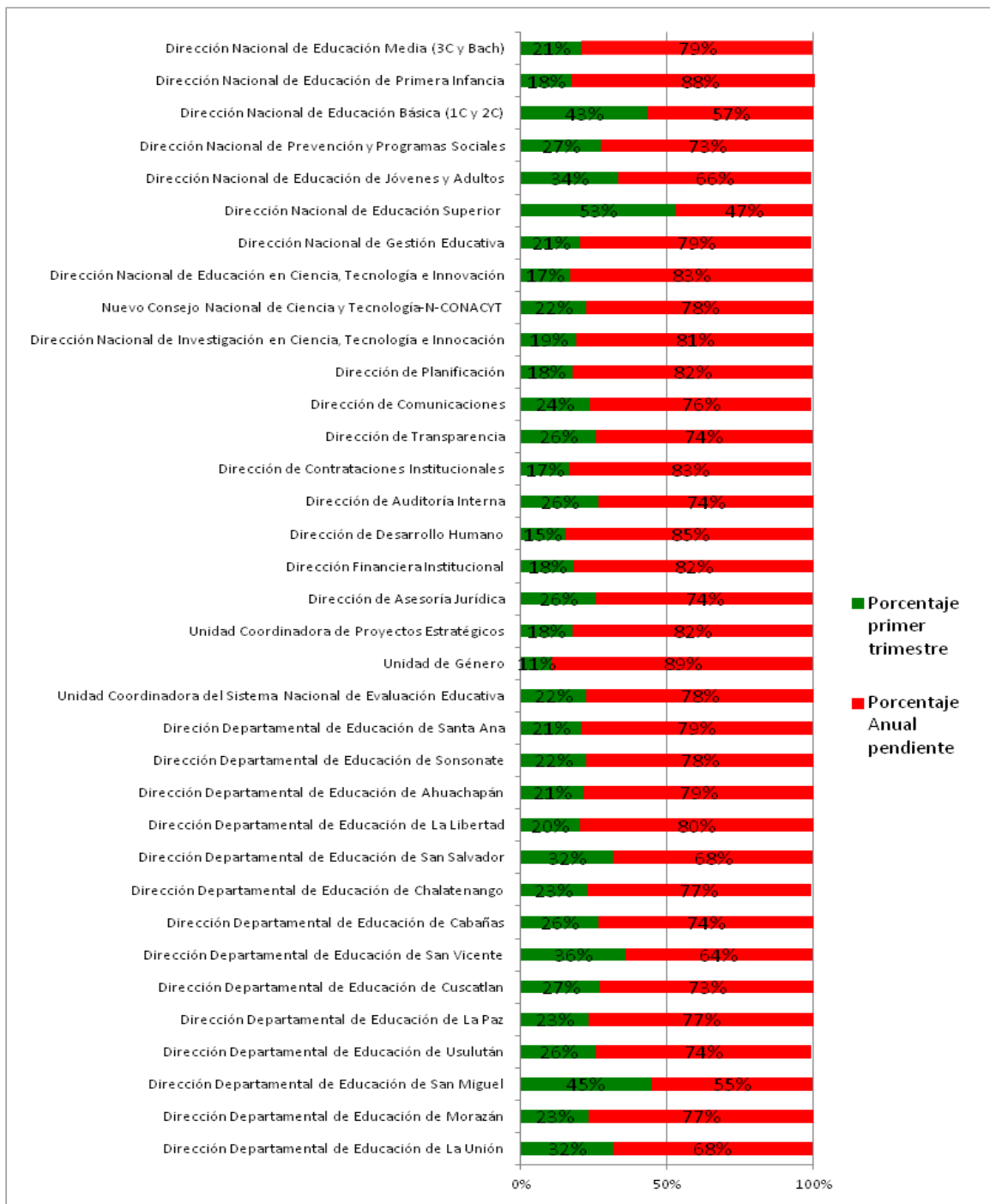
Gráfico de nivel de avances de macro actividades 1° Trimestre 2018

En el siguiente gráfico de la ejecución de macro actividades al 1° trimestre del año 2018, se representa en color verde los porcentajes de avances en ejecución y en color rojo el porcentaje de ejecución pendiente.