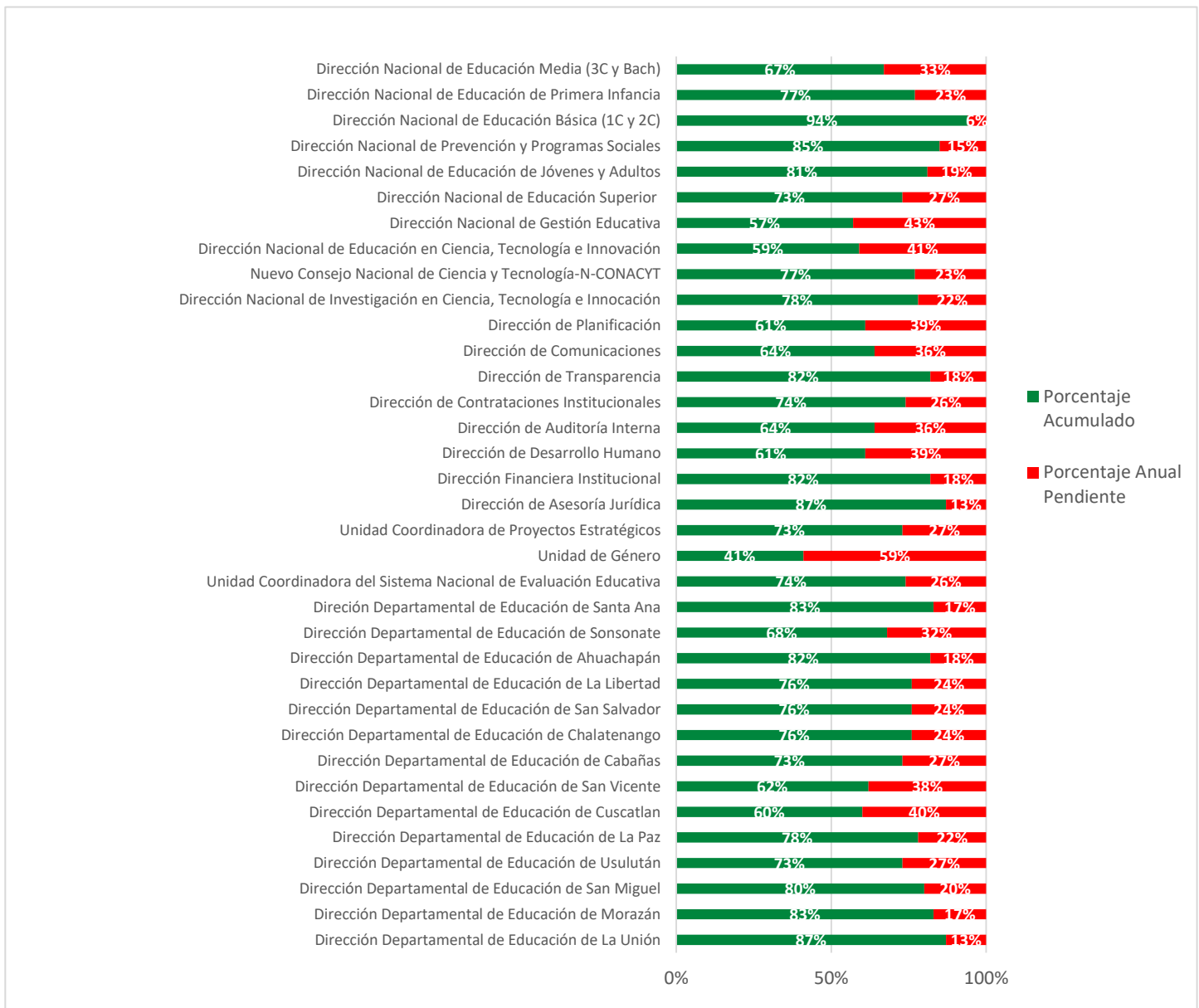
Gráfico de nivel de avances de macro actividades 3° Trimestre 2018