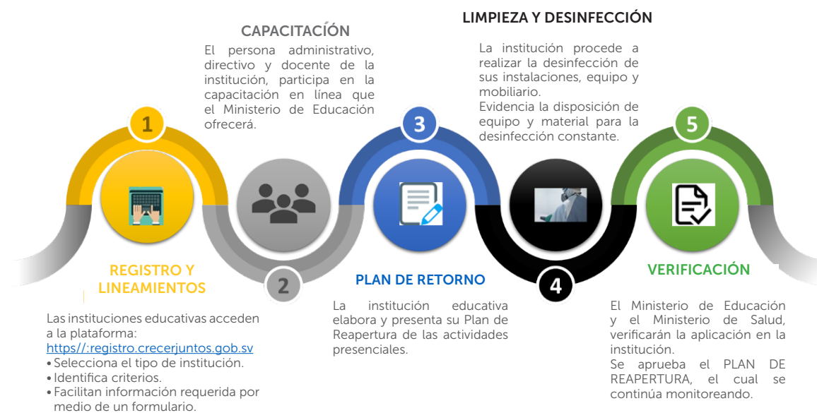
Imagen 1. Pasos para el retorno de las clases presenciales y semipresenciales

Ninguna institución educativa podrá convocar a estudiantes, sin la previa presentación del plan y la obtención del certificado, de acuerdo a los pasos siguientes: