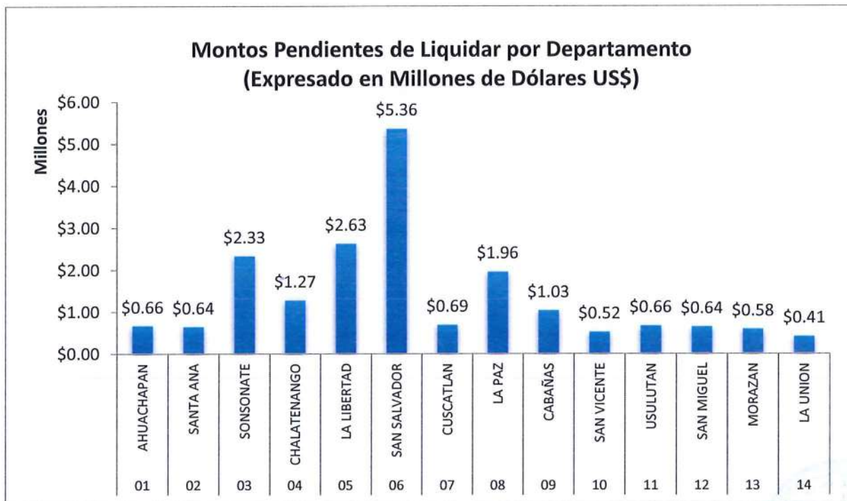
Gráfico N.º 1: Distribución de fondos no liquidados por departamento