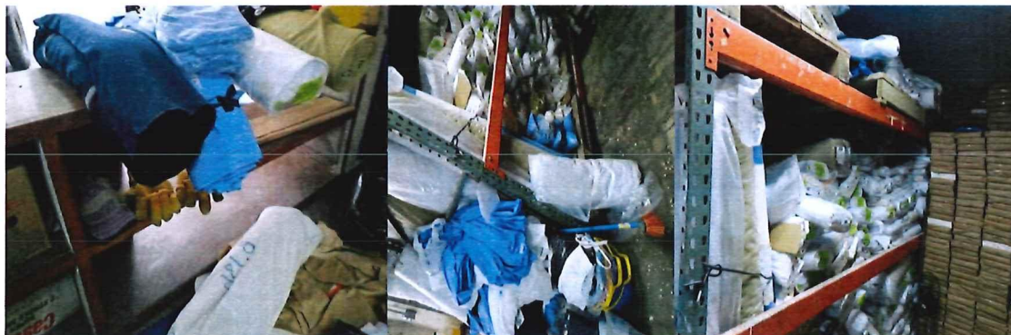
Imágenes de Bodega de San Salvador (a cargo de [redacted])