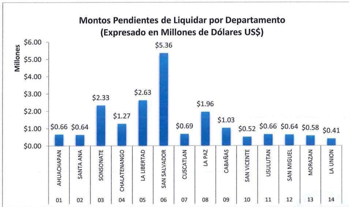
Gráfico N° 1: Distribución de fondos no liquidados por departamento

Fuente: Sistema de Liquidación de Componente en Concepto de Presupuesto Escolar (Liquidación Central)