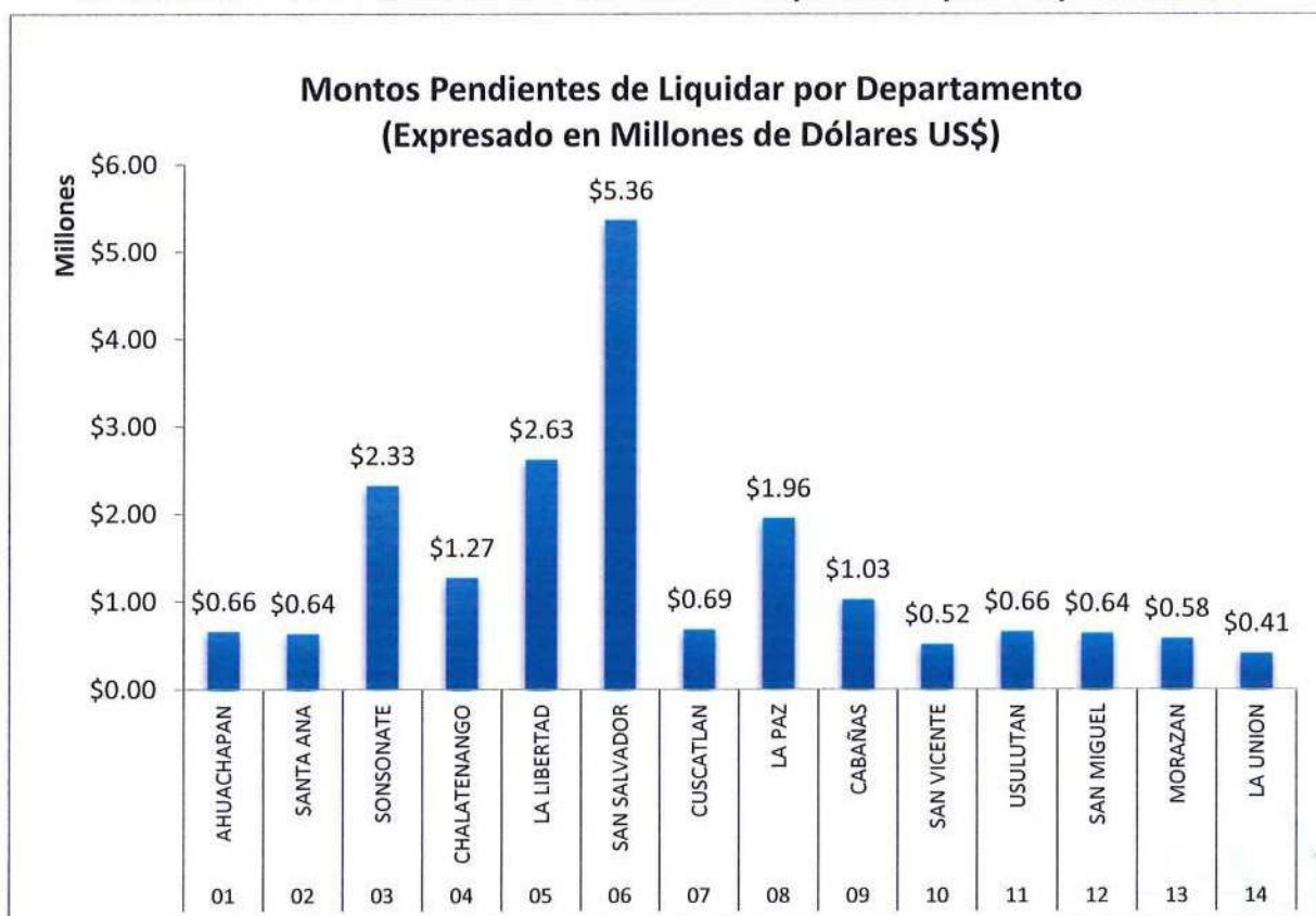
Gráfico N.º 1: Distribución de bonos no liquidados por Departamento.