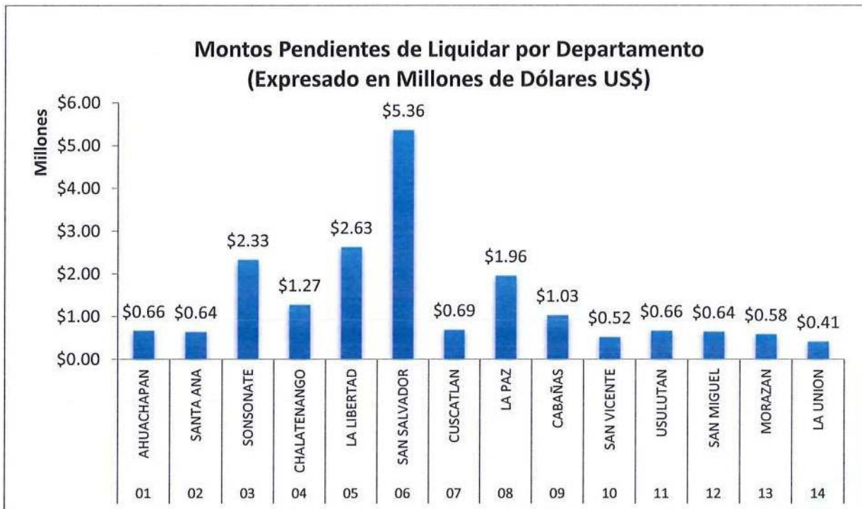
Gráfico N.º 1: Distribución de fondos no liquidados por departamento