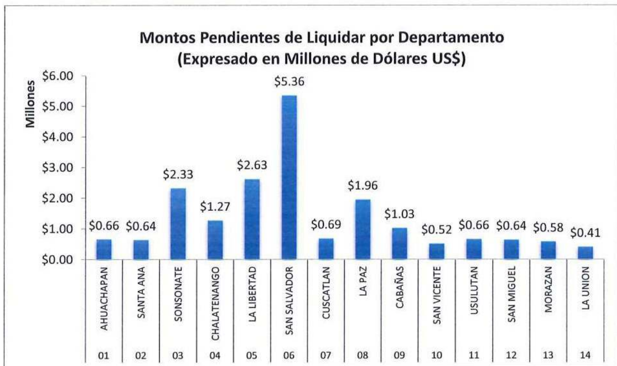
Gráfico N.º 1: Distribución de fondos no liquidados por departamento