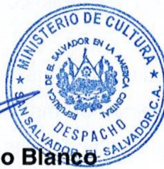
Maestra Silvia Elena Regalado Blanco Ministra de Cultura de El Salvador.

El Presente Plan Estratégico Institucional, entrará en vigencia a partir de la firma de la Ministra de Cultura.