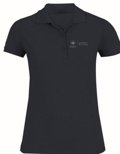
Camisa tipo Polo (femenino y masculino) color: Azul pantone 281 c