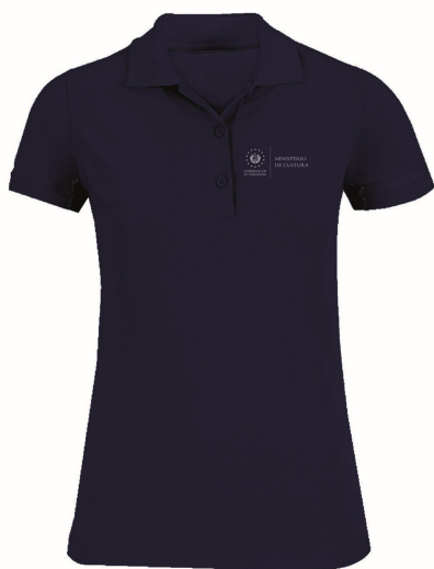
Camisa tipo Polo (femenino y masculino) color: Cool gray pantone 11 c