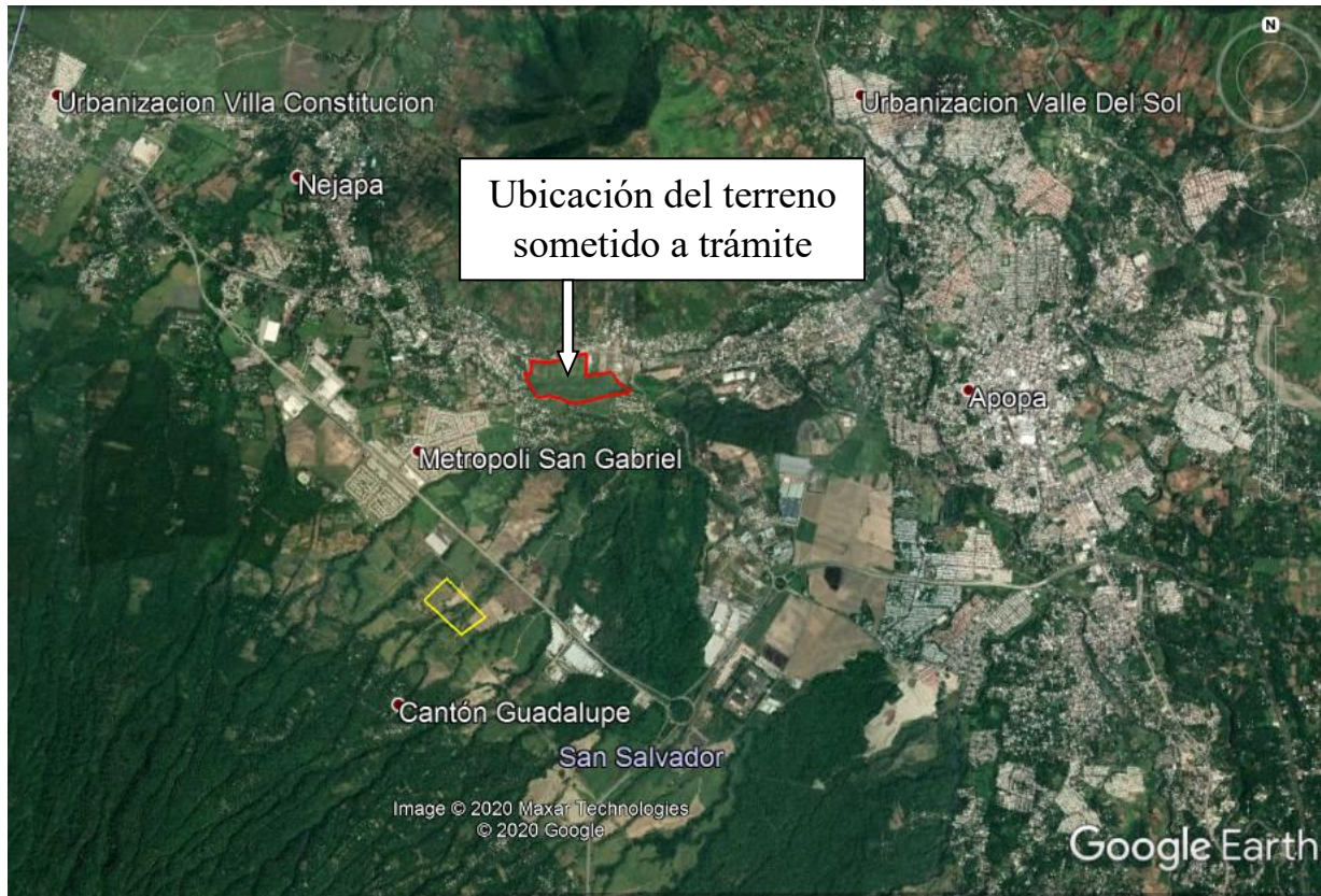
Imagen. Se muestra la ubicación del inmueble sometido a valoración cultural. La inspección determinó que el inmueble no posee valor cultural.