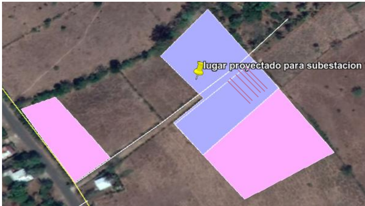
Imagen. Vista satelital tomada de Google Earth, en la que se señalan en rosa, los sectores en los que se identificaron estructuras prehispánicas en superficie, en celeste, la zona escogida por ETESAL para el desarrollo de la subestación y la parte celeste marcada con líneas, área dentro del inmueble que piensa adquirir ETESAL, en la que se observó al menos una estructura en superficie.

b) Que en la prospección realizada a dicho inmueble, se identificó un centro ceremonial prehispánico que se extiende en las parcelas circundantes, de hecho, parte del área que abarcará el proyecto de ETESAL, contiene al menos una estructura. Se contabilizan 7 edificaciones visibles (5 montículos y 2 plataformas), sin que esto signifique que sean las únicas. Asociado a estos, se observaron fragmentos de material cultural correspondientes a cerámica y obsidiana, así como 2 manos de moler. Pese a que dentro del espacio destinado al proyecto solo se aprecia una estructura, existe una alta probabilidad que el resto del inmueble resguarde acervo cultural pretérito en el subsuelo, ya que claramente todo el espacio formó parte del antiguo asentamiento prehispánico.