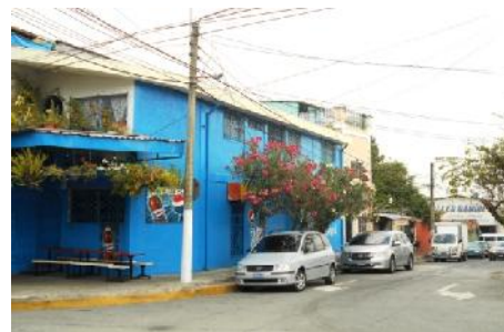
Calle Cuscatlán, entre 3a Avenida Norte y Pasaje 4