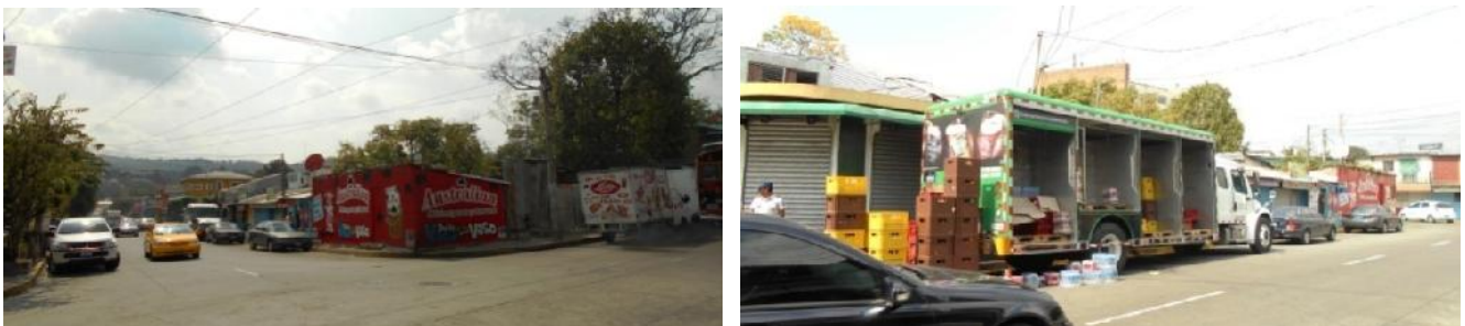
1a Calle Poniente, entre 1a y 3a Avenida Norte