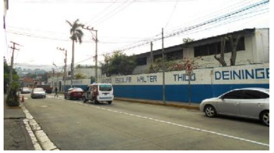
Calle Antigua Cuscatlán, desde Calle Cuscatlán