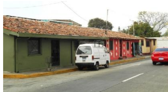
Pasaje 4, entre 1a Calle Poniente y Calle Cuscatlán