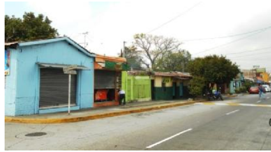
1a Calle Poniente, entre Pasaje 4 y Avenida Navas Norte