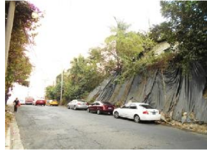
3a Avenida Norte, entre 1a Calle Poniente y Calle Cuscatlán