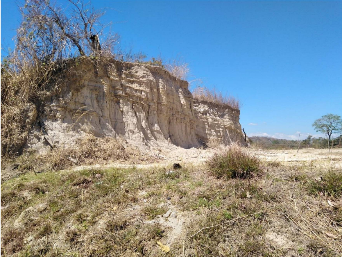
Foto. Vista del corte realizado en el terreno colindante al terreno donde se desarrollará el proyecto, en donde se pueden apreciar los sedimentos portadores característicos de la zona, que consisten en sedimentos laminares, especialmente lutitas, que en su interior preservan fósiles de plantas y peces.

c) Estos estratos son comunes en la zona, siendo previamente identificados por parte de la Sección de Paleontología, en los Sitios Paleontológicos de El Paraíso, Las Aradas y Santa Fe, del municipio de El Paraíso (Aguilar, D. H, 2008; Aguilar, D. H & Molina, M. A., 2012; Alvarenga, D. I., 2019), el Sitio Paleontológico El Cobano (Novoa, E., 2010), en el municipio de Santa Rita, y en el Sitio Paleontológico San Francisco Lempa, en el municipio de San Francisco Lempa (Aguilar, D. H., 2014). Dichos estratos corresponden a un complejo sedimentario de la antigua cuenca del Paleolago Lempa, que se formó aproximadamente hace 5 millones de años, en el Plioceno, y el cual da origen a la cuenca actual del río Lempa, aproximadamente 1.8 millones de años (Hernández, W., 2005)