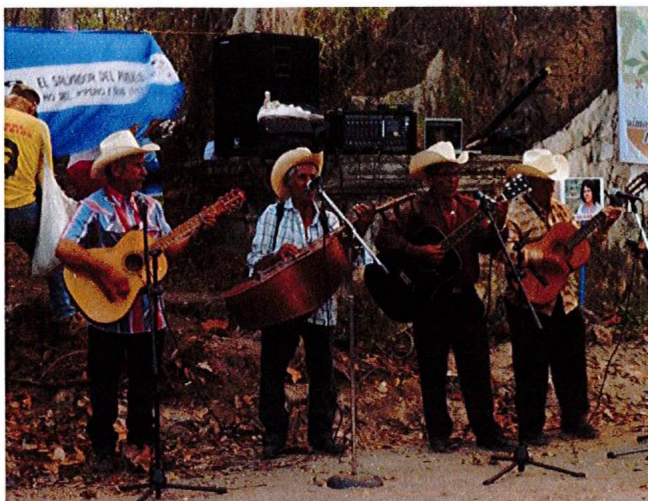
Grupo musical presente en conmemoración 2016 27