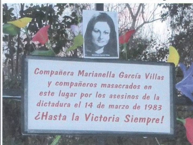
Afiche informativo de la conmemoración 2015 24