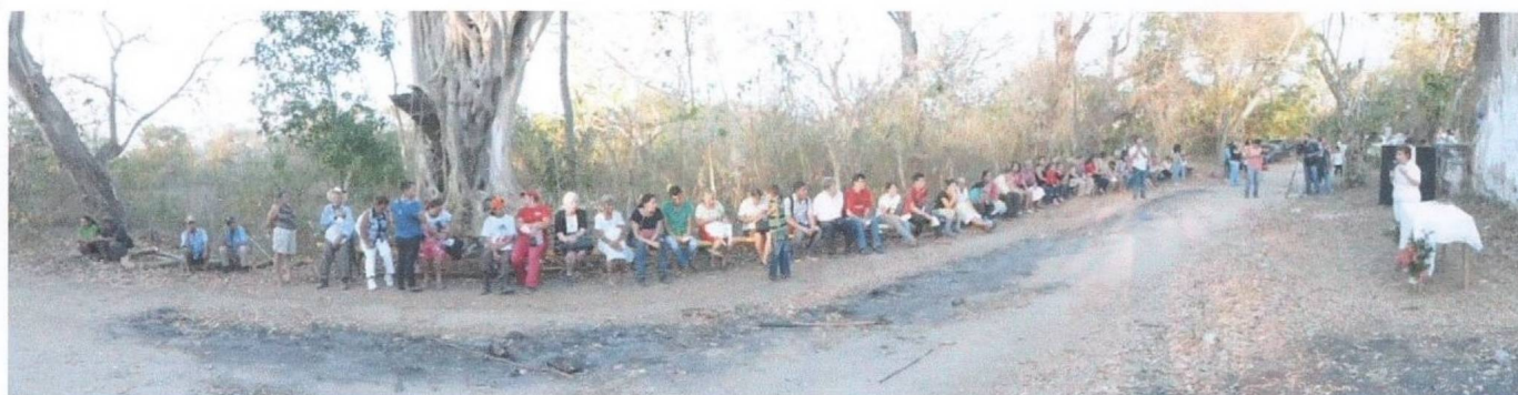
Plano general de la conmemoración 2015 23 .