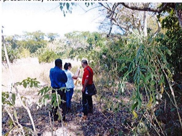
Miembros de comunidad muestran el lugar en el que se presume hay víctimas enterradas 30