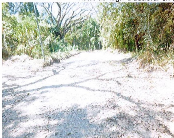
Vía de acceso interna desde la parte occidental del terreno