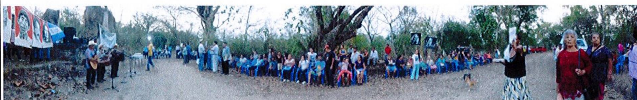
Plano general de la conmemoración 2016 28