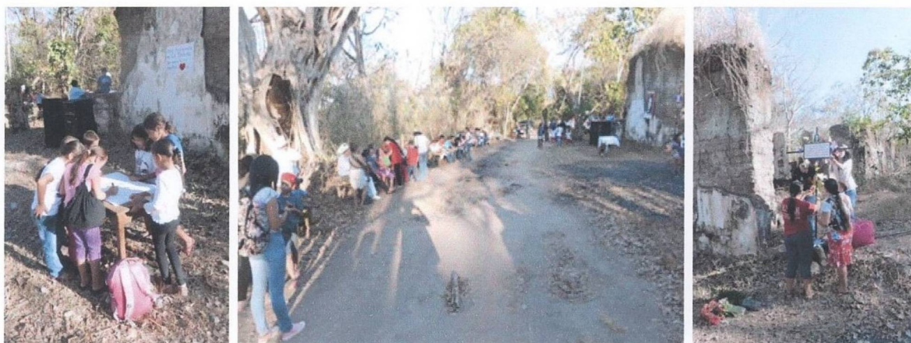
Conmemoración, 2015 22