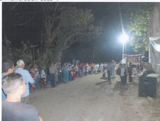
vista nocturna de conmemoración 2016 25