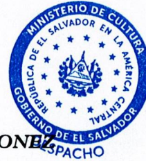
MARIEM EUNICE PLEITEZ QUIÑONE MINISTRA CULTURA