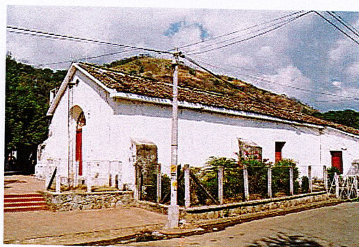
Iglesia parroquial Nuestra Señora de La Paz.

La presente copia es conforme a la Original.