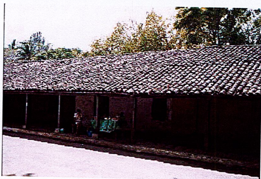
Vista de los portales ubicados en el costado poniente del parque Central.