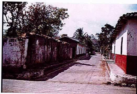
Vista de la 1ª Calle Poniente.