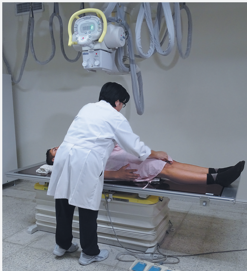
5 hospitales de la red pública nacional fueron fortalecidos con equipos de Rayos X digital y ultrasonografías: San Rafael de Santa Tecla, La Libertad; Ilobasco y Sensuntepeque de Cabañas; Santa Gertrudis de San Vicente y Jiquilisco de Usulután.