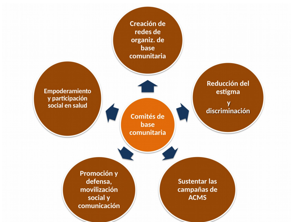
Figura 3 Responsabilidades de los comités comunitarios