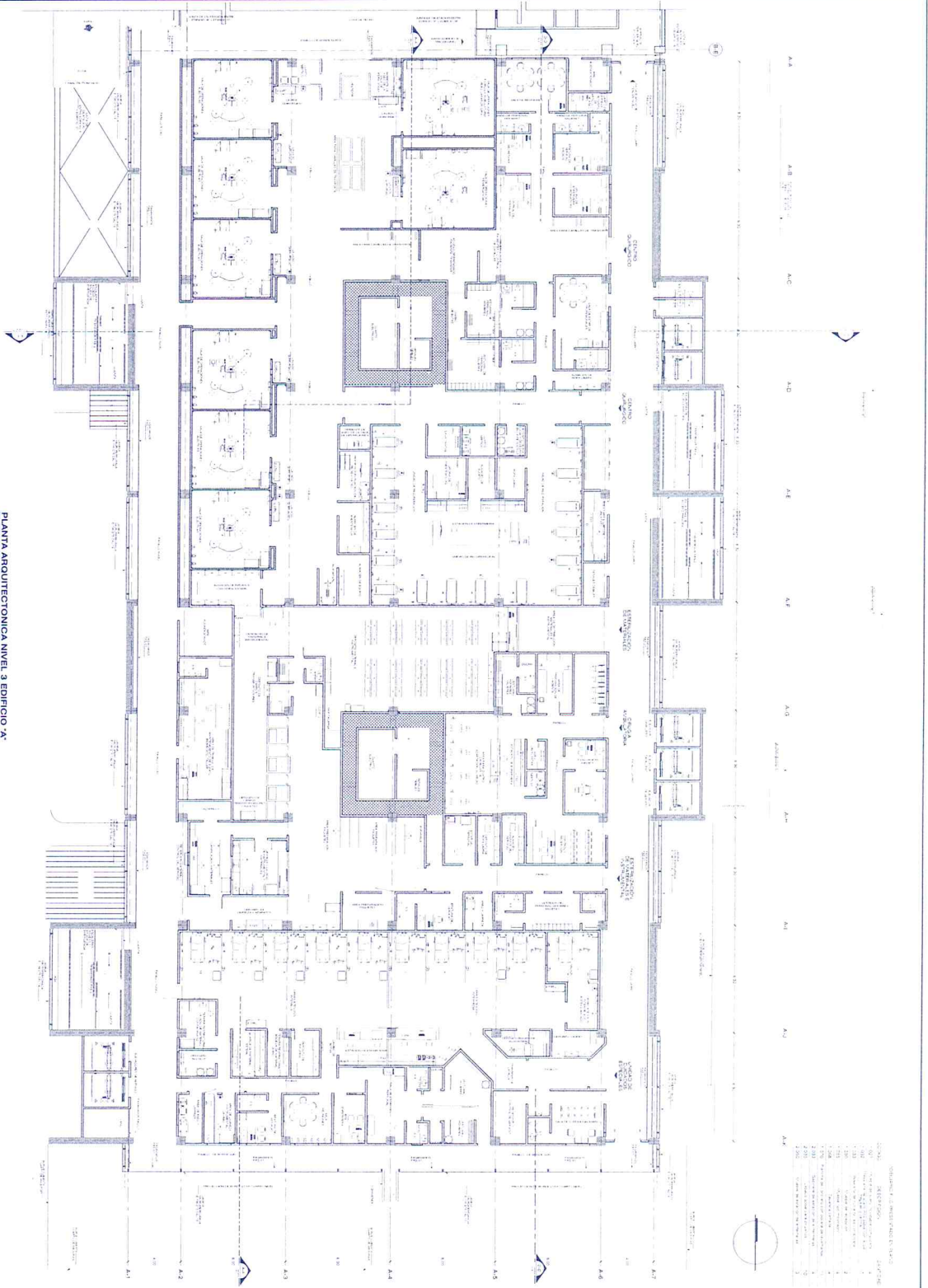
PLANTA ARQUITECTONICA NIVEL 3 EDIFICIO 'A'