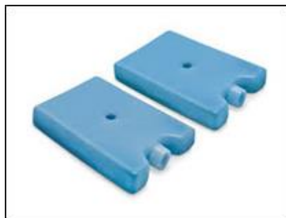
Ejemplo de hielera y gel congelante (pingüinos)