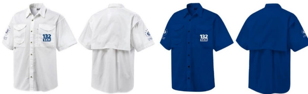
Imagen 7. Personal de administrativo Opción 1: Camisa tipo Columbia institucional azul o blanca