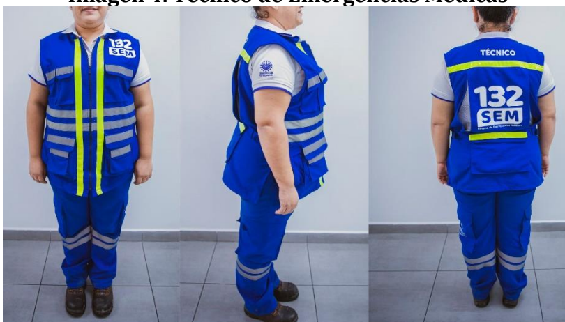
Imagen 4. Técnico de Emergencias Médicas