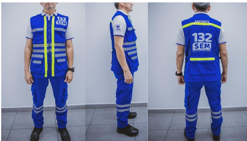
Imagen 3. Asistente de Emergencias Médicas