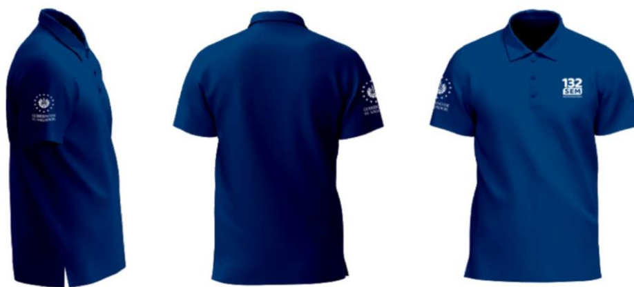
Imagen 9. Personal de administrativo Opción 3: Camisa tipo Polo institucional azul