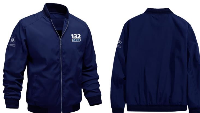
Imagen 10. Personal de Administrativo Modelo de chumpa institucional azul.