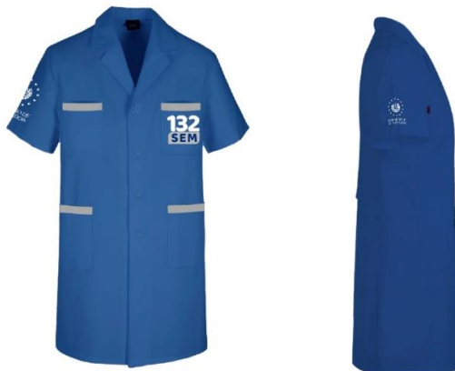
Imagen 6. Personal de Unidad de Infraestructura, Mantenimiento y Servicios Generales y Unidad de Conservación y Mantenimiento de Flota (gabacha de trabajo)