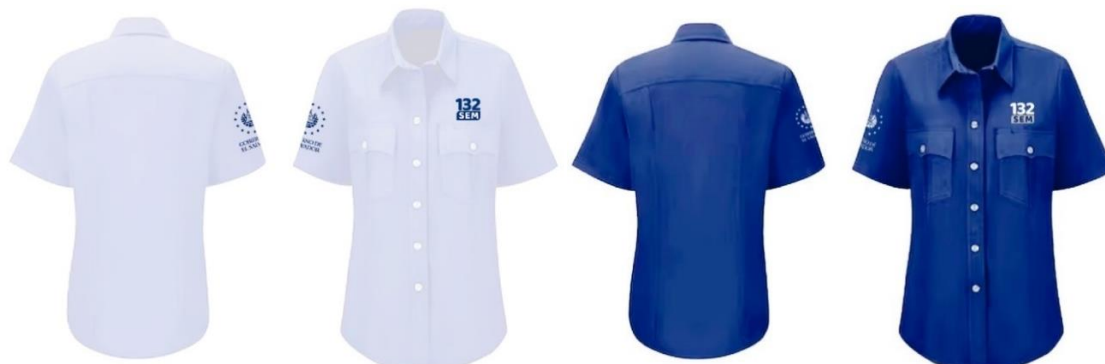
Imagen 8. Personal de administrativo Opción 2: Camisa tipo Oxford institucional azul o blanca