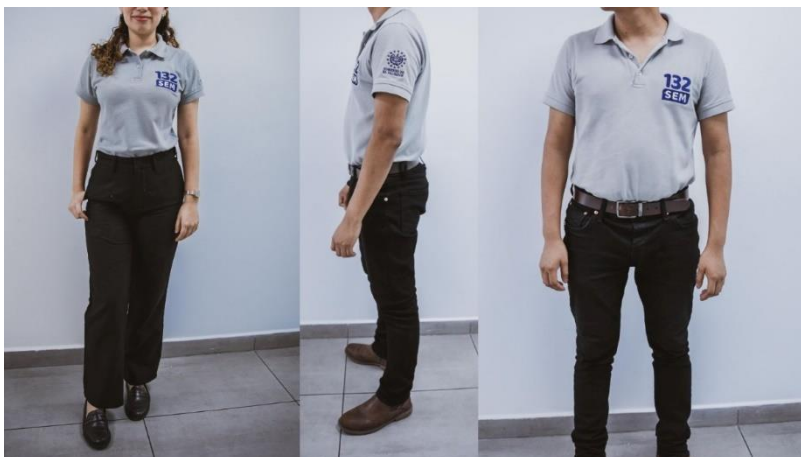
Imagen 2. Personal de Centro Coordinador