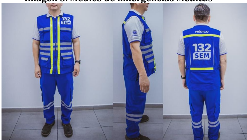
Imagen 5. Médico de Emergencias Médicas