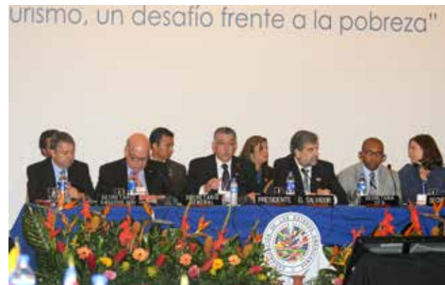
Conferencia de prensa del XIX Congreso Interamericano de Turismo.