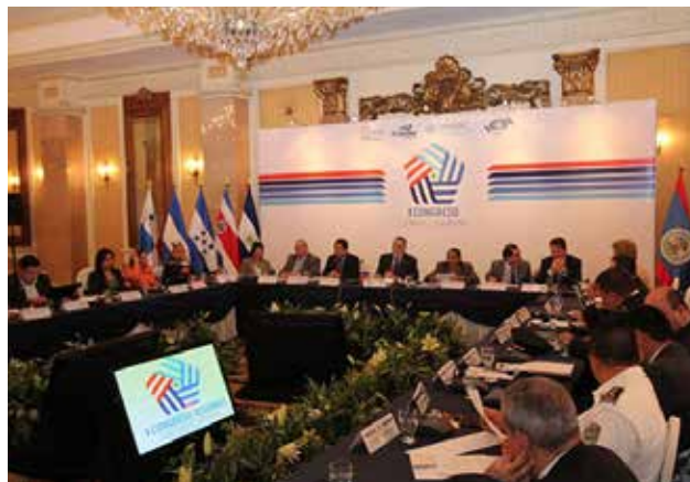
Autoridades regionales durante la sesión inaugural del Congreso de Turismo y Seguridad

El Ministerio de Turismo identificó y propuso a la Asociación de Estados del Caribe –AEC.- a los Cóbanoes en el departamento de Sonsonate como Destino de la Zona de Turismo Sostenible del Gran Caribe (ZTSC).