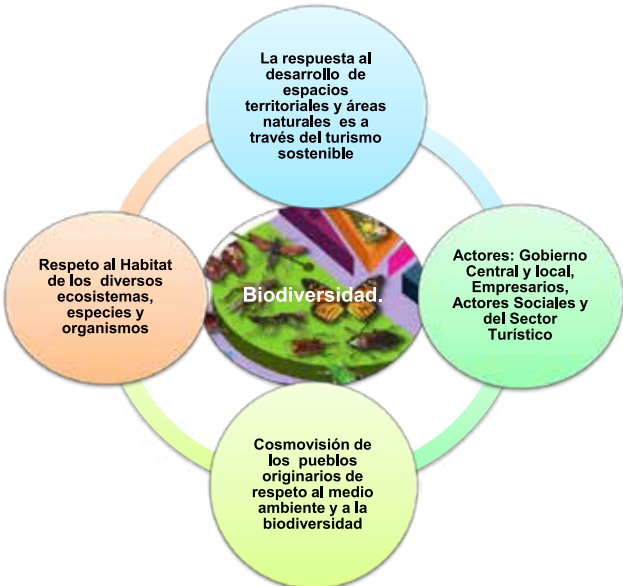
Gráfico No. 2 Principales factores para la integración de la biodiversidad en el Sector Turístico

El crecimiento previsto y las nuevas tendencias plantean una oportunidad para el turismo y a la vez, una exigencia para una diversificación de productos y destinos, especialmente para el turismo de naturaleza, con actividades de ecoturismo, turismo rural comunitario, etnoturismo y agroturismo, segmentos que están en armonía con el medio ambiente y el respeto a la diversidad natural y cultural de las comunidades.