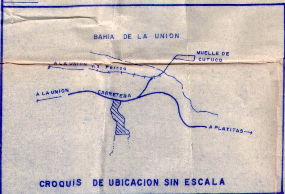
CROQUIS DE UBICACION SIN ESCALA