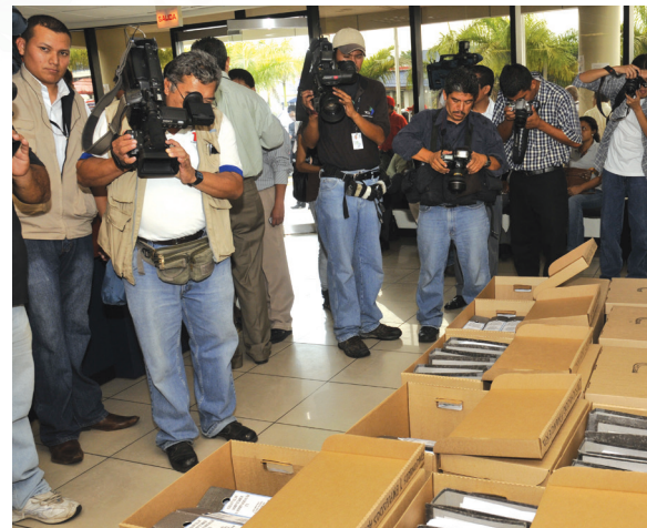
Secretaría de Asuntos Estratégicos y MOP presentan ante Fiscalía denuncia por irregularidades en proyecto

- Verificar y asegurar el cumplimiento de los planes estratégicos y operativos, a través de mecanismos de seguimiento, utilizando indicadores que permitan medir el cumplimiento de objetivos, metas y plazos establecidos en los planes, programas y proyectos.