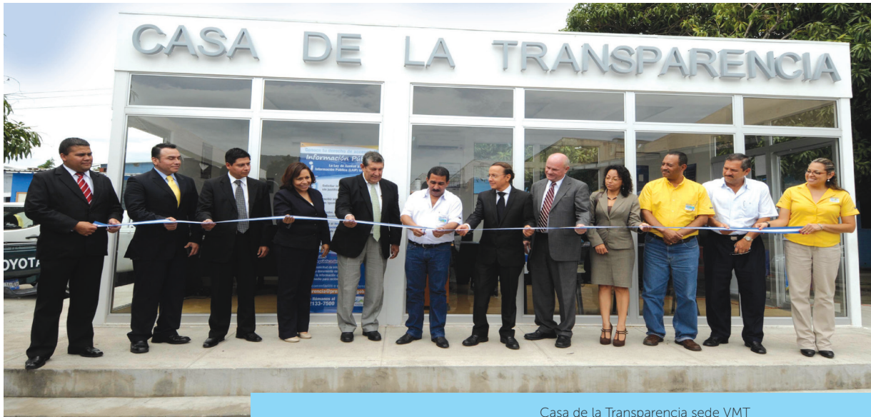
Casa de la Transparencia sede VMT

• Desarrollo de paquetes de datos para uso de la ciudadanía.