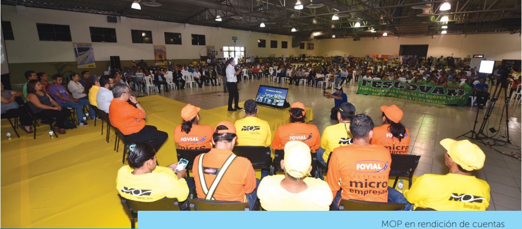
MOP en rendición de cuentas