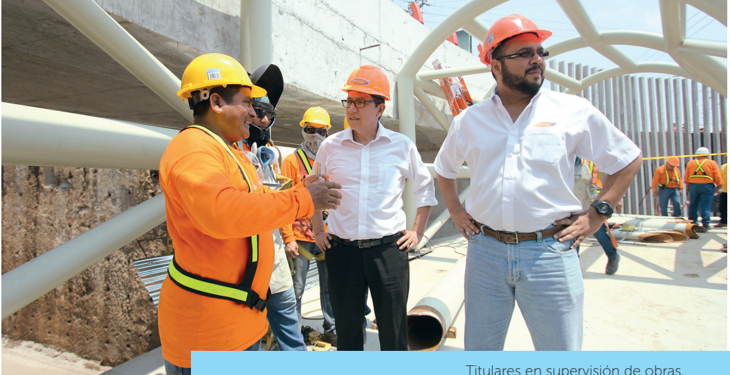
Titulares en supervisión de obras.