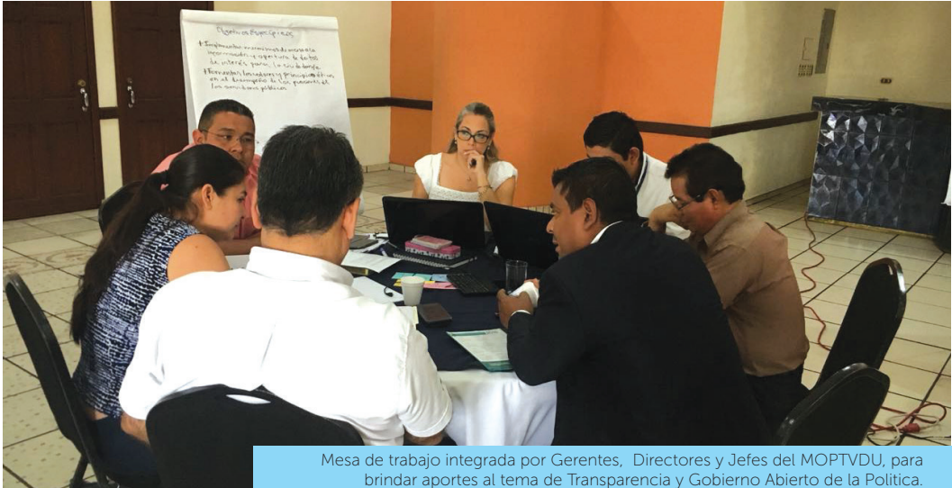
Mesa de trabajo integrada por Gerentes, Directores y Jefes del MOPTVDU, para brindar aportes al tema de Transparencia y Gobierno Abierto de la Política.