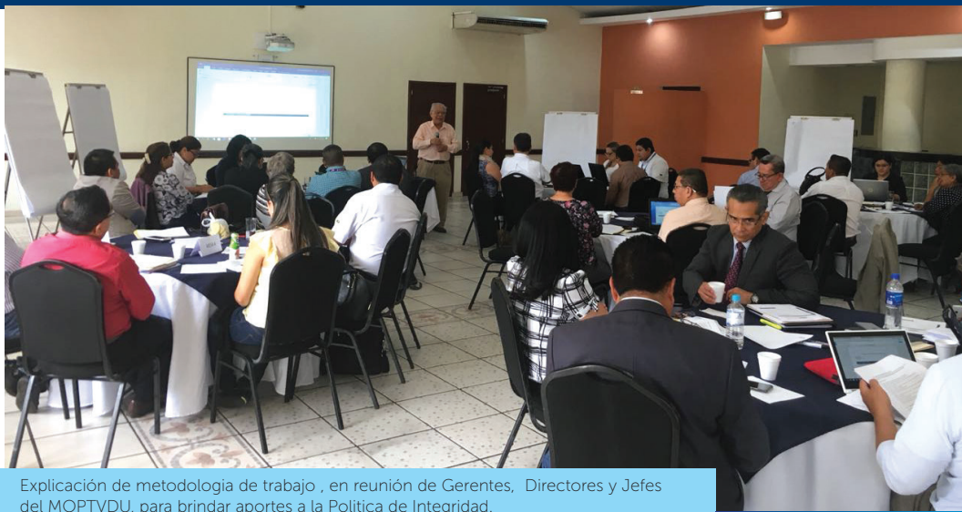
Explicación de metodología de trabajo, en reunión de Gerentes, Directores y Jefes del MOPTVDU, para brindar aportes a la Política de Integridad.

La medición en el MII se hace de forma periódica y cada vez se identifican nuevas oportunidades de mejora, con lo que se formulan los respectivos planes para el logro de dichas mejoras de manera continuada.