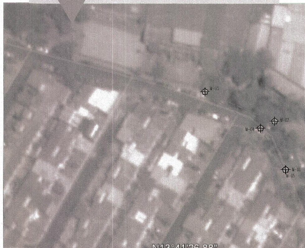
UBICACION DEL PROYECTO