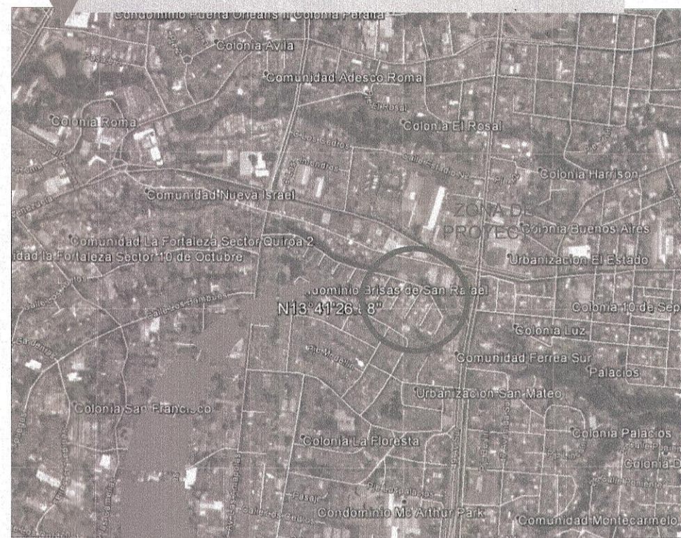
MICRO UBICACION DEL PROYECTO