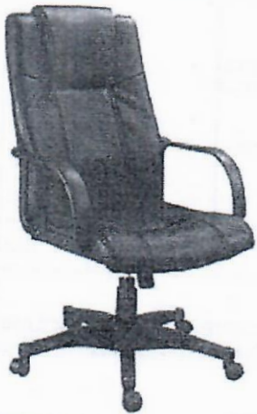
ITEM No. 1- SILLON TIPO EJECUTIVO