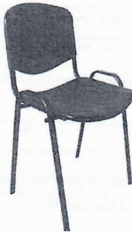
ITEM No. 2 – SILLA DE ESPERA